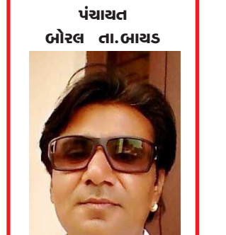
અતુલભાઈ પટેલ અધિકુન્જ સોસાયટી બાયઢ જુલો અરવલ્લી