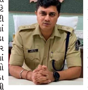
આ પ્રોજેક્ટ અંતર્ગત આ વર્ષે ૧૯૮ વિદ્યાર્થીઓને પરિક્ષા લક્ષી