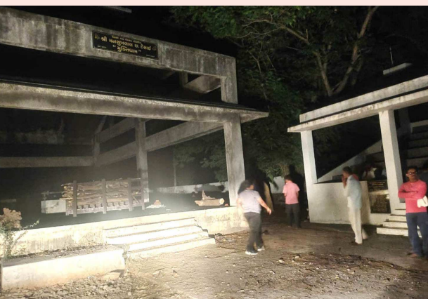
અરવલ્લી જિલ્લામાં સગભાં મહિલાઓએ રોડના અભાવે પદયાત્રા કરીને પહોંચેલા ડાયુઓએ ગાડીઓને હેડ લાઈટ ચાલુ કરીને અંતિમક્રિયા કરવી પડે તે કેટલી હદે યોગ્ય છે, તે સવાલ છે. ગામડાના માનવીને કોઈ જ વસ્તુની કે પ્રાથમિક સુવિધાની જરૂર નથી તેનું તાલુકા તંત્ર અને જિલ્લા તંત્ર માની રહ્યું છે. માત્ર લાઈટ જેવી સુવિધા ન કરી સુંદર હોય તો મોટા કામ કેવી રીતે પાર પાડી શકે તે એક સવાલ છે.