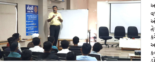
પરીક્ષાનું માર્ગદર્શન પ્રોજેક્ટ ચલાવવામાં આવે છે જેમાં આજ સુધીમાં ૧૦૦ કરતા વધારે ઉમેદવારોને નોકરી છવાયેલ છે જેનાથી ઉત્સાહિત થઈ આ વર્ષમાં પણ પરીક્ષાર્થીઓ માટે કોચિંગ ક્લાસ ચલાવવામાં આવે છે.