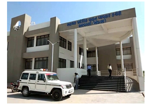
ગેરકાયદેસર બનીજ વહન કરતા વાહનને ઝડપી લીધા પછી મોટી રકમનો દંડ ભરવો પડશે તેમ

નામના બે ફોલ્ડરિયાને મેદાનમાં ઉતારવામાં આવે છે જે વાહન પકડયું હોય તેના ચાલક કે માલિકનો સંપર્ક કરી તેમને આરટીઓ અધિકારી સાથે સારા સંબંધ છે અને તમારે ૧૫ થી ૨૦ હજાર રૂપિયા સરકારી દંડ થશે તેમ જણાવી જો પતાવટ કરવી હોય તો કહો તો બરોબર પતાવી આપીશું કહી વાહન ચાલક કે માલિક સાથે પ થી ૧૦ હજાર રૂપિયામાં ડીલ નક્કી કરી બંને અધિકારીને તોડની રકમ વ્યાજબી લાગે તો બંને ફોલ્ડરને લીલી ઝંડી આપતા જ વહેવાર કરી વાહન છોડી મુકવામાં આવે છે અને આ રીતે વાહનચાલકો પાસેથી રૂપિયા ખંબેરવાંના આ આખા કૌભાંડની શરૂઆત થાય છે અને તોડ કરી સરકારી તિજોરીને વર્ષે દહાડે લાખો રૂપિયાનો ચૂનો લગાવી અધિકારીઓ અને ફોલ્ડરિયા બિસ્સા ભરી રહ્યા હોવાનું જણાવ્યું હતું. એ આરટીઓ કચેરીમાં ઝડપાવેલા વાહનો માંથી કેટલા વાહનો પાછો મારકીટ દંડ વસુલવામાં આવ્યો અને કેટલા પાસેથી તોડ કરવામાં આવ્યો તે જાણવું હોય તો ગાંધીનગર કમિશનર કચેરી દ્વારા અરવલ્લી જિલ્લા એઆરટીઓ કચેરીની બહાર લાગેલા સીસીટીવી કેમેરા છેલ્લા ૬ માસના ચેક કરવામાં આવે તો દૂધનું દૂધ અને પાણીનું પાણી થઈ શકે છે.