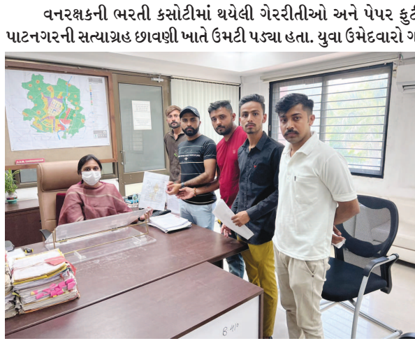
માંગ ઉમેદવારો દ્વારા કરવામાં આવી છે.

વનરક્ષકની ભરતી કસોટીમાં થયેલી ગેરરીતીઓ અને પેપર ફુટી જવા સામે યુવા ઉમેદવારો આજે પાટનગરની સત્યાગ્રહ છાવણી ખાતે ઉમેદી પડ્યા હતા. યુવા ઉમેદવારો ગાંધી ચિંધ્યા માર્ગે આંદોલન કરવા માટે એકઠા થયા હતા. ત્યારે વનરક્ષક પરિક્ષા રદ કરવાની માંગ સાથે ઉમેદવારોએ જિલ્લા કલેક્ટરને આવેદન પત્ર પાઠવી યોગ્ય કરવા રજુઆત કરી હતી. ઉલ્લેખનીય છે કે વર્ષ ૨૦૧૮માં વનરક્ષકની પરિક્ષા જાહેર થઈ હતી અને ૪ વર્ષ બાદ પરિક્ષા લેવામાં આવી હતી. ત્યારે પેપરમાં ગેરરીતી થતા રાજ્યના અંદાજીત ૫ લાખથી વધુ ઉમેદવારોનું ભાવિ ઝોખામાં છે. ત્યારે સરકાર દ્વારા તાત્કાલીક પોરણે યોગ્ય નિર્ણય કરવામાં આવે તેવી માંગણીઓ રમી રહ્યા છે.