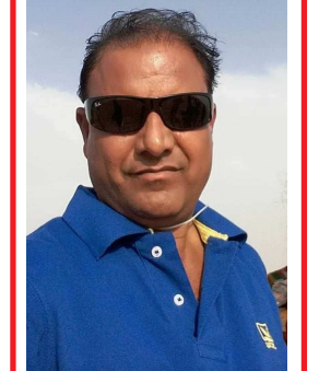
કોશિકભાઈ પટેલ સહજાનંદ સોસાયટી ભાયડ