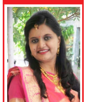
પુસ્તુબેન આદિત્યકુમાર પટેલ કેમાર હાલ વડોદરા