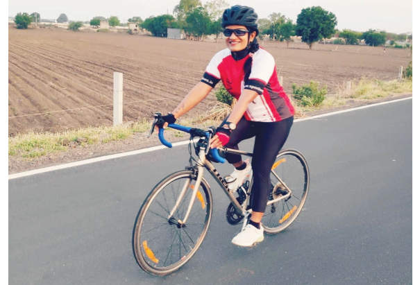
પાનગી કોર્પોરેટ ઓફિસો અને સરકારી ઓફિસોમાં સાયકલ દ્વારા પાટનગર ગાંધીનગરને સાઈકલવાનું માધ્યમથી પ્રદૂષણ

(૧) કોઈ બાળક નિશાળ બહાર માલૂમ પડે તો તેના માતા-પિતાનો સંપર્ક કરીને પ્રાથમિક શિક્ષણની યોજનાઓનો લાભ લઈ બાળક ફરીથી ભણતો થાય તેની કાળજી લઈએ (૨) બાળક પાસે મજૂરી કરાવવામાં આવતી માલૂમ પડે તો સંબંધિત અધિકારીને તેની જાણ કરી કાયદાકીય પગલા લેવડાવીએ. (૩) જ્યાં બાળમજૂર કામ કરતો હોય ત્યાં ગ્રાહક ન બનીએ, બાળકોની સેવા તથા બાળકોએ બનાવેલી વસ્તુઓનો બહિષ્કાર કરીએ જેથી બાળમજૂરી કરાવનાર માલિકને આર્થિક લુકશાન થશે પરીણામે પુષ્ટ વચની વ્યક્તિને કામે રાખવાની ફરજ પડશે. બાળમજૂરી નાબૂદ કરવાનું આ સૌથી સરળ અને ચોચ પગલું છે.