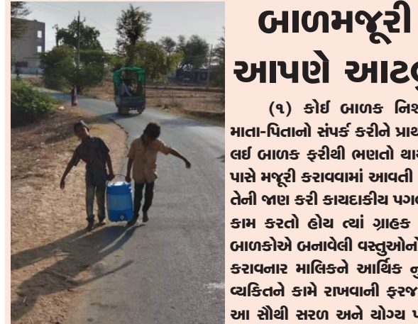
પછી તેના બાળકની હાલત પણ તેના જેવી જ થાય. આ બાળમજૂર ભવિષ્યમાં અભણ મતદાર તથા નિષ્ક્રીય - અજાગૃત નાગરીક બને. પરીણામે કુટુંબ, ગામ, સમાજ તથા દેશ બરબાદ થાય. વળી બાળમજૂરીને કારણે બાળકને

(૪) બીડી અને સિગાર કામદાર (રોજગારી શરતો) અધિનિયમ, ૧૯૬૬ ની કલમ - ૨૪ (૫) ઈન્ડિયન પીનલ કોડની કલમો ૩૭૦ અને ૩૭૪ અન્વયે (૬) જુવેનાઈલ જસ્ટીસ એક્ટ ૨૦૦૦ ની કલમ - ૨૩, ૨૪ અને ૨૬ વિશેષમાં સુપ્રિમ કોર્ટ દ્વારા રીટ પીટીશન નંબર ૪૬૫/૮૬માં આપવામાં આવેલ ચુકાદા અન્વયે દરેક જીલ્લા કલેક્ટરના અધ્યક્ષપણા હેઠળ 'બાળમજૂર પુનર્વસન અને કલ્યાણ નિધિ' ની રચના કરવામાં આવેલ છે. ઉપરોક્ત ચુકાદા પ્રમાણે જોખમી ધંધાઓમાં બાળમજૂરને કામે રાખવામાં આવેલ હોય તો જે તે ઉદ્યોગ ધંધાના માલિક પાસેથી પ્રત્યેક બાળમજૂર ટીક રૂ. ૨૦૦૦૦ વસૂલ કરી ઉકત બાળમજૂર પુનર્વસન અને કલ્યાણ નિધિમાં જમા કરાવવાના રહે છે.