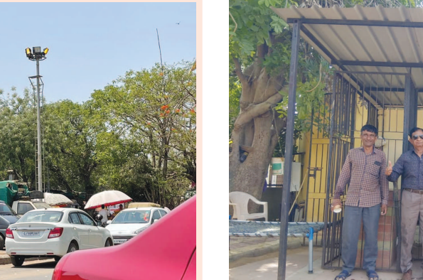
૪૩ ડિગ્રી ની અંગ દઝાડતી કાળઝાળ ગરમીમાં ભરબપોરે એક વાગ્યે સેક્ટર-૨ ૧ ની શાક માર્કેટ પાસેની સ્ટ્રીટલાઈટ ચાલુ છે. એક તરફ ખેડૂતો ને વીજળી નથી મળી રહી અને અહીંયા ભર બપોરે સ્ટ્રીટ લાઈટ ચાલુ રાખવામાં આવે છે.

ગાંધીનગર, તા.૯ સંસ્કાર ગ્રુપ દ્વારા રામનવમી નિમિત્તે સે-૭, બગીચા ખાતે સવારે ૯.૩૦ થી ૧૦.૧૫ સુધી કાર્યક્રમનું આયોજન કરવામાં આવ્યું છે તથા નાના બાળકોને ગરમીથી બચવા ટોપી વિતરણ કરવામાં આવશે. પરીશ્રાથીઓને શુભેચ્છા પાઠવવા પેનો આપવામાં આવશે.