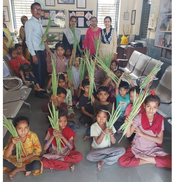
શાળામાં ઉગાડેલો સરગવો ૨૧ જરૂરિયાતમંદ બાળકોને આપવામાં આવ્યો હતો. સાથે દરેક શિક્ષક સરગવાના ફાયદા પણ વિદ્યાર્થીઓને સમજાવ્યા હતા.