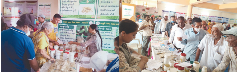
આયુર્વેદ શાખા, જીલ્લા પંચાયત ગાંધીનગર ધ્વારા આયુષ મેગા કેમ્પનું હનુમાનજી મંદિર ઉભોડા ગામ ખાતે આયુર્વેદ અને હોમિયોપથી સર્વરોગ નિવાર સારવાર કેમ્પનું આયોજન કરવામાં આવ્યું હતું જેમાં મોટી સંખ્યામાં લોકો જોડાયા હતા અને કાર્યક્રમને સફળ બનાવ્યો હતો.