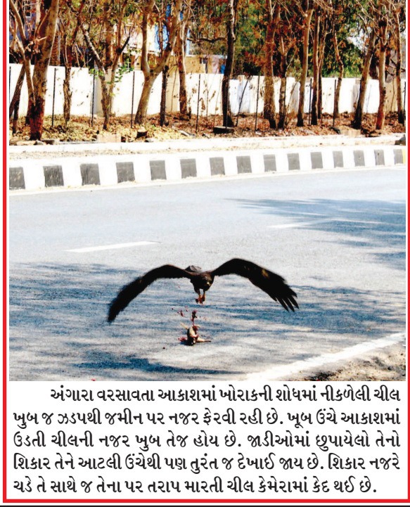
અંગારા વરસાવતા આકાશમાં ખોરાકની શોધમાં નીકળેલી ચીલ ખુબ જ ઝડપથી જમીન પર નજર ફેરવી રહી છે. ખૂબ ઉંચે આકાશમાં ઉડતી ચીલની નજર ખુબ તેજ હોય છે. જાડીઓમાં છુપાયેલો તેનો શિકાર તેને આટલી ઉંચેથી પણ તુરંત જ દેખાઈ જાય છે. શિકાર નજરે ચડે તે સાથે જ તેના પર તરાપ મારતી ચીલ કેમેરામાં કેદ થઈ છે.