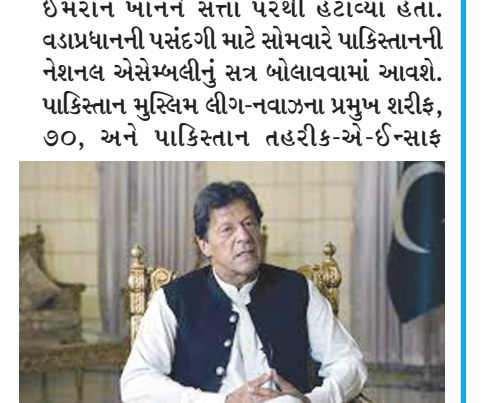
(પીટીઆઈ) ના ઉપાધ્યક્ષ અને ભૂતપૂર્વ વિદેશ પ્રધાન શાહ મહેમૂદ કુરેશીએ રવિવારે આ પદ માટે ઉમેદવારી પત્ર ભર્યું હતું. ડોન સમાચારના અહેવાલ મુજબ, કેબિનેટ વિભાગે સંધીય કેબિનેટના ૨૨ સભ્યો, ૨૫ સંધીય મંત્રીઓ, ચાર રાજ્ય મંત્રીઓ, વડાપ્રધાનના ચાર સલાહકારો અને ૧૮ વિશેષ સહાયકોને બિન-સૂચિત કર્યાં છે.

ઈસ્લામાબાદ, તા. ૧૧ પાકિસ્તાનના વડાપ્રધાન ઈમરાન ખાને જાહેરાત કરી છે કે તેઓ કોઈપણ સંજોગોમાં સંસદમાં નહીં બેસશે. પાકિસ્તાન તહરીક-એ-ઈન્સાફની સંસદીય દળની બેઠકમાં ઈમરાન ખાને કહ્યું કે તેઓ ચોરો સાથે નહીં બેસે. કહેવામાં આવી રહ્યું છે કે આ બેઠકમાં પીટીઆઈના તમામ સાંસદોના સામૂહિક રાજીનામાનો નિર્ણય લેવામાં આવ્યો છે. દરમિયાન આજે શાહબાઝ શરીફ પાકિસ્તાનના નવા વડાપ્રધાન બને એમ હોવાનું મનાય છે. આ દરમિયાન ઘણા સાંસદોએ પણ રાજીનામા આપવાનું શરૂ કરી દીધું છે. જિયો ન્યૂઝે સૂત્રોને ટાંકીને જણાવ્યું હતું કે, અમે કોઈ પણ સંજોગોમાં સંસદમાં બેસીશું નહીં. તેમણે કહ્યું કે પીટીઆઈના સાંસદો એવા ચોરો સાથે નહીં બેસે જેમણે પાકિસ્તાનને લૂંટ્યું છે.