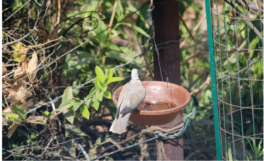
દગડાટી ગરમીમાં શેકાઈ રહ્યા છે. મહત્તમ તાપમાન પણ મોટાભાગે ૪૧ ડીગ્રીની આસપાસ જ જોવા મળે છે. જો કે ગઈકાલે ગરમીનું વચ્ચે જ રહ્યો છે. જેના લીધે આકાશમાંથી અંગારા વરસાવની ગરમીથી સૌ કોઈ તોભા પોકારી ગયા છે. ગઈકાલની સાપેક્ષમાં તાપમાનમાં પણ ગરમીની જેમ રોજબરોજ તફાવત જોવા મળી રહ્યો છે. આજે લઘુત્તમ તાપમાન પણ ૩.૮ ડીગ્રી નીચે ઉતરી ગયું

મહત્તમ તાપમાન એક ડીગ્રી ઉચકાયુ : ગરમી વધવાની સાથે લઘુત્તમ તાપમાનમાં પણ નોંધપાત્ર ૩ ડીગ્રીનો ફેરફાર ગાંધીનગર તા ૧૨ ગાંધીનગરમાં શિયાળાની ઠંડીના દિવસોની જેમ ઉનાળો પણ આકરો પુરવાર થઈ રહ્યો છે. ગત સપ્તાહમાં ગરમીનો મિજાજ ઉગ્ર બનતા સિઝનની રેકર્ડ બ્રેક ગરમી નોંધાઈ હતી. ગઈકાલે ગરમીનો પારો ૪૦ ડીગ્રીએ રહ્યો હતો જેના લીધે છેલ્લા કેટલાક દિવસોથી અસહ્ય ગરમી અનુભવતા નગરજનોએ પ્રમાણમાં રાહત અનુભવી હતી જ્યારે આજે ફરી ગરમીનું જોર વધી ગયું છે. આજે મહત્તમ તાપમાન ૪૦.૮ ડીગ્રી પહોંચી ગયું હતું. દિવસ દરમિયાન આકરી લું માં નગરજનો શેકાયા હતા. છેલ્લા ઘણાં સમયથી એકાદ દિવસને બાદ કરતા મહત્તમ તાપમાન ૪૧ ડીગ્રીની આસપાસ જ રહે છે.