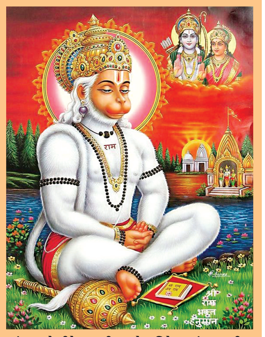
સંકટ કટે મીટે સબ પીરા, જો સુમિરે હનુમંત બલવીરા

લદાખમાં ભૂકંપના હળવા આંચકા મહેસૂસ કરવામાં આવ્યા હતા. લદાખમાં ભૂકંપના આંચકાની તીવ્રતા ૪.૬ મેગ્નિટ્યુડ માપવામાં આવી હતી. જાણકારોના મતે ભૂકંપના આંચકા ભુધવારે ૧૦.૨૪ મિનિટ પર મહેસૂસ કરવામાં આવ્યા હતા. આ આંચકા કારણે ગિલગી ૩૨૮ કિલોમીટર ઉત્તરમાં મહેસૂસ થયા.