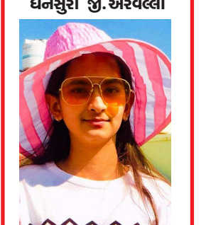
જેમી વિક્રમભાઈ પંચાલ સ્વામીનારાયણ સોસાયટી બાયડ જી.અરવલ્લી