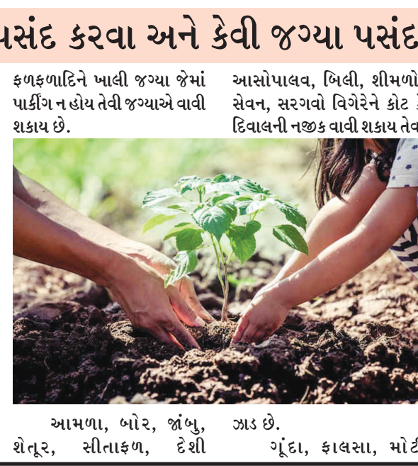
આમળા, બોર, જાંબુ, શેતૂર, સીતાફળ, દેશી આસોપાલવ, બિલી, શીમળો, સેવન, સરગવો વિગેરેને કોટ કે દિવાલની નજીક વાવી શકાય તેવા

ગાંધીનગર, તા. ૧૯ ગાંધીનગર એટલે ગ્રીનસીટી હરિયાળા નગર તરીકે ઓળખાતા આ ગાંધીનગરમાં વૃક્ષોની સંખ્યા વધારે છે. સાથે સાથે વૃક્ષ પ્રેમીઓની સંખ્યા પણ અઢળક છે. તેથી જ તો પાટનગરમાં વૃક્ષો ચારેય કોર નજરે ચઢે છે. ગાંધીનગરમાં કોઈ ઘર એવું બાકી નહીં હોય જ્યાં વૃક્ષ જોવા મળતું ન હોય. ગાંધીનગરમાં એટલી બધી જાગૃતિ છે કે વૃક્ષોની કાપણી અટકાવવા માટે તેઓ વિરોધ પ્રદર્શન અને એક જૂથ થઈને જવાબદાર તંત્ર સામે અવાજ ઉઠાવે છે ત્યારે ગાંધીનગરમાં