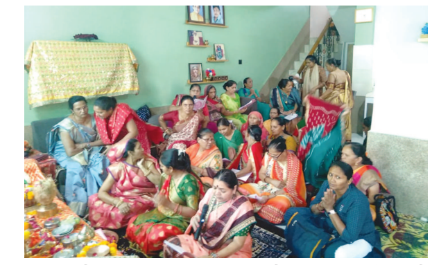
માં મેલડી આનંદ ગરબા મંડળ દ્વારા મોટી સંખ્યામાં ભાવિ ભક્તોની ઉપસ્થિતિમાં આનંદનો ગરબો યોજાવ્યો હતો.

ગાંધીનગર, તા. ૧૯ રોટરી ક્લબ ઓફ કેપિટલ, ગાંધીનગર અને જલીયાણ સેવા ગ્રુપ દ્વારા મુક્તિધામ (સ્મશાન), આદર્શ નિવાસી કન્યા શાળા - સે. ૮, એચઆઈવી બાળકોની સંસ્થા સે. ૧૯, અંધ શાળા - સે. ૧૬, બહેરા-મૂંઝા શાળા, સે. ૨૮, આંગણવાડી સે. ૨૪, આંગણવાડી સે. ૨૭, આંગણવાડી સે. ૩૦ સહિત જરૂરીયાતમંદ લોકોને ૧૫૦ કિલો ચીકુ અને ૩૦ કિલો ટેટીનું વિતરણ કરવામાં આવ્યું હતું.