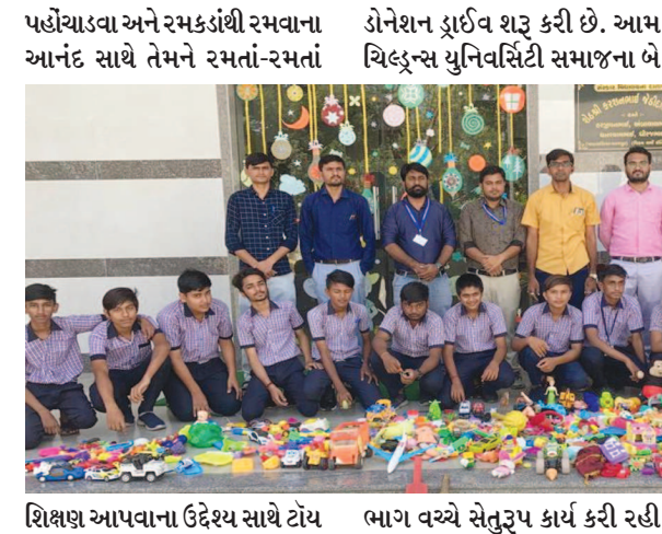
શિક્ષણ આપવાના ઉદ્દેશ્ય સાથે ટોચ ભાગ વચ્ચે સેતુરૂપ કાર્ય કરી રહી વિસ્તારોમાં જઈને લોકોને તેમના

૩૫૦૦ જેટલાં રમકડાં એકત્ર થયા છે. આગામી સમયમાં ઝુંબેશમાં એન.જી.ઓ. તેમજ સામાજિક-ધાર્મિક સંગઠનોને જોડવામાં આવશે. આ અંગે ચિલ્ડ્રન્સ યુનિવર્સિટીની સ્કૂલ ઓફ ઈન્ટિક સ્ટડીઝના ડાઈરેક્ટર ડૉ. નિમિશ વસોયાએ જણાવ્યું કે, એક તરફ અનેક એવા પરિવારો છે, જેમાં બાળકો મોટાં થઈ ગયાં છે અને તેમનાં રમકડાં એમને એમ પડી રહ્યાં છે. બીજી તરફ રાજ્યમાં એવા ગરીબ-વ્યથિત પરિવારો છે, જેમના બાળકોએ રમકડાં જોવાં પણ નથી. આવા બાળકો સુધી રમકડાં