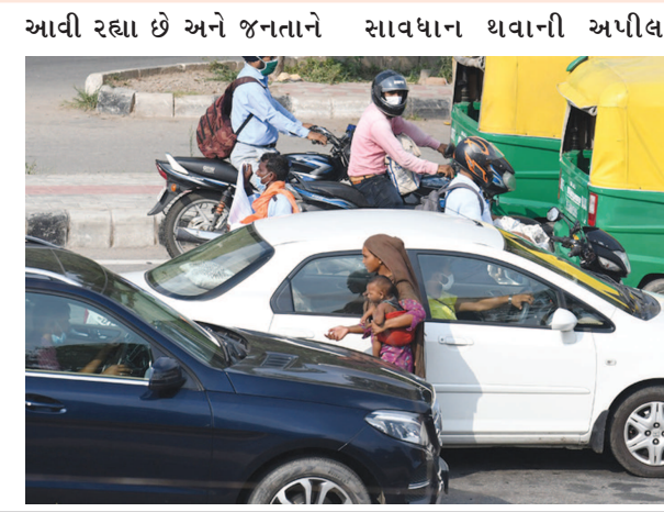
આવી રહ્યા છે અને જનતાને સાવધાન થવાની અપીલ કરવામાં આવી રહી છે.

જોવા મળે છે ત્યારે વર્ષોથી જે ગાંધીનગરમાં ભિખારી જૂથ ક્યાંય આંખે નહોતો વળગતો તે વર્તમાન સમયગાળામાં ઘણી બધી જગ્યાએ શહેરમાં જોવા મળે છે. ગાંધીનગરમાં જયારથી ચાર રસ્તાઓ ઉપર ટ્રાફિક સિગ્નલો લગાવાયા છે ત્યારથી ભિખારી જૂથની સંખ્યામાં વધારો જોવા મળી રહ્યો છે. ત્યારે જાગૃત નાગરિકો દ્વારા સમાજના નાગરિકોને સાવધાન કરવા માટે વિવિધ સકારાત્મક વિચારો સાથિયલ મિડીયા થકી મુકવામાં