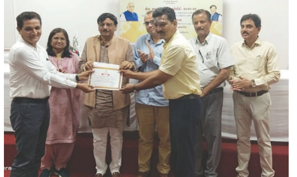
તાલીમ સંસ્થાની પસંદગી કરવામાં આવે છે. પસંદ કરેલ ઔદ્યોગિક તાલીમ સંસ્થાઓને પારિતોષિક પેટે મળેલ પુરસ્કૃત રકમનો ઉપયોગ ઉત્તરસંડાને તૃતીય ક્રમ માટે પસંદગી કરવામાં આવી છે. આજરોજ મંત્રી શ્રી બ્રિજેશ મેરજાના હસ્તે પાલનપુર ઔદ્યોગિક

આજે વાતાવરણમાં પલ્ટો જોવા મળ્યો હતો તેમજ પવનની ગતિ પણ જોવા મળી હતી તે માવઠાનો સંકેત હોવાની ચર્ચા હોકજાભે થતી સાંભળવા મળી હતી. ગાંધીનગર જિલ્લા બાળ સુરક્ષા સમિતિની બેઠક આજે મળવાની હતી પરંતુ અનિવાર્ય કારણોસર મોકૂફ કરી દેવામાં આવી હતી. બ્રિટનના વડાપ્રધાનની મુલાકાતને લઈ તંત્ર આજે તેની તૈયારીમાં વધુ વ્યસ્ત બન્યું છે. બે દિવસમાં બે દેશના પ્રધાનમંત્રી ગાંધીનગરમાં હોવાથી તંત્રની કામગીરી વધી છે. ગાંધીનગર શહેરમાં નીલ ગાયનો ત્રાસ વધી રહ્યો હોવાની ફરિયાદો વધવા પામી છે. સે. ૨૨માં બેક ઓફ બરોડાથી 'ય' ને 'ઘ' ટાઈપ વચ્ચેના સર્વિસ રોડ પર જે રીતે રેતી પાથરવામાં આવી છે તેણે સેક્ટરવાસીઓમાં ચર્ચા જગાવી છે. સરખેજથી ગાંધીનગર આવતી બસો ભાગવતુ વિદ્યાપીઠના નિયત કરેલા સ્ટેન્ડ પર ઉભી રાખવામાં ન આવતાં કોલેજોના વિદ્યાર્થીઓને પારવાર મુશ્કેલીનો સામનો કરવો પડી રહ્યો છે. ૧૬ વર્ષમાં ૨૨ ગામોમાં ગૌરવ શૂન્ય થયાની વાત અંગે જવાબદારો સામે પગલાં લેવાની માંગ કરતો પત્ર એક સેવાભાવી સંગઠને લખ્યો હોવાનું જાણવા મળેલ છે. સિંગતેલ અને કપાસિયા તેલમાં ભાવ વધારો થતાં ગૃહીણીઓની મુશ્કેલી વધી છે. મેલેરિયા તંત્ર દ્વારા હાથ ધરાયેલ બીજા તબક્કાના સર્વેલન્સની કામગીરીમાં રિપોર્ટિંગ નહિ કરવા આરોગ્ય મંડળના આદેશને પગલે તંત્રને ભારે મુશ્કેલી પડી રહી છે.