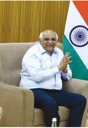
ગાંધીનગર, તા. ૨૦ મહાત્મા મંદિરમાં આયોજિત આયુષ ઇન્વેસ્ટમેન્ટ એન્ડ ઇનોવેશન સમિટના વડાપ્રધાન નરેન્દ્રભાઈ મોદી દ્વારા ઉદઘાટન અવસરે સહભાગી થયેલા મોરેશિયસના પ્રધાનમંત્રી ઉદઘાટન સમારોહ બાદ મુખ્યમંત્રી ભૂપેન્દ્ર પટેલને રૂબરૂ મળ્યા હતા અને આયુર્વેદ સહિતની પ્રાચિન ઉપચાર પદ્ધતિમાં ગુજરાતના

યોગદાન અંગે વિચાર વિમર્શ પણ કર્યાં હતાં. મોરેશિયસ દ્વારા ગિકેટસીટીમાં રોકાણ અંગે પણ આ બેઠકમાં ચર્ચા હાથ ધરાઈ હતી. મુખ્યમંત્રી ભૂપેન્દ્ર પટેલે મોરેશિયસના વડાપ્રધાને સરદાર સાહેબની વિશ્વની વિરાટ પ્રતિમા સ્ટેચ્યુ ઓફ યુનિટિની મુલાકાત લેવા આમંત્રણ પાઠવ્યું હતું. મોરેશિયસના પ્રધાનમંત્રીએ