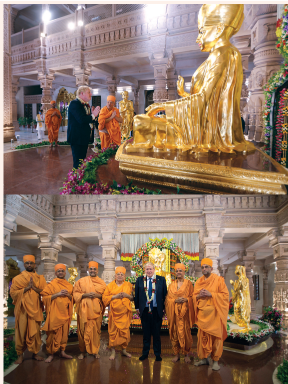
મોવેરા મહેમાન - જગપ્રસિદ્ધ અક્ષરધામની મુલાકાતે ગુરુવારે સાંજે શ્રિદેવના વડાપ્રધાન ભોરીસ જહોન્સન પધાર્યા હતા... બી.એ.પી.એસ.ના સંતોએ જહોન્સનનું ભાવભીનું સ્વાગત કરી સમગ્ર અક્ષરધામ પરિસરની વિગતોથી વાકેફ કરી સ્વામિનારાયણ ભગવાનના દર્શન કરાવ્યા હતા અને અભિષેક પણ કર્યો હતો... ભોરીસ જહોન્સન અક્ષરધામની મુલાકાતથી મંત્રમુગ્ધ બન્યા હતા અને સમગ્ર સંસ્થાના સંતો અને સેવકોના સમર્પણ ભાવને બિરદાવ્યા હતા... વૈદિક મહાસત્તામાના એક ભોરીસ જહોન્સનની મુલાકાતથી ગાંધીનગરનું અને બી.એ.પી.એસ.નું ગૌરવ વધ્યું હતું...