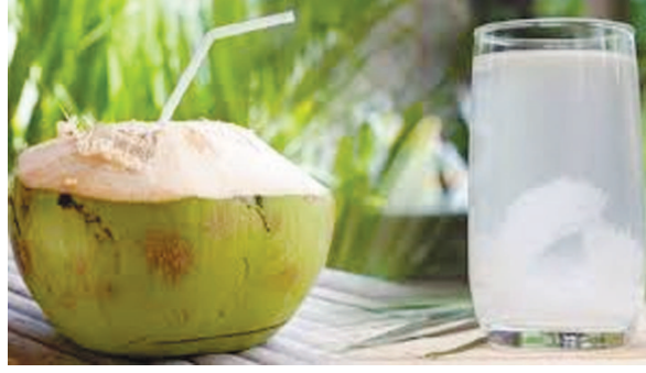
કારણે ફળકળાદિની ડિમાન્ડ હતી જેથી કોરોના મહામારી ખાતે

નારિયેળ ગ્રાહકોને મળી રહ્યું છે. ગયા વર્ષે કોરોના મહામારીને વધી ગઈ હતી તેવામાં નારિયેળ પાણીની પછ ખૂબ ડિમાન્ડ રહી