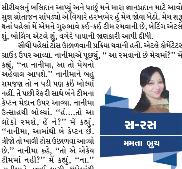
સ-રસ મમતા ભુવ