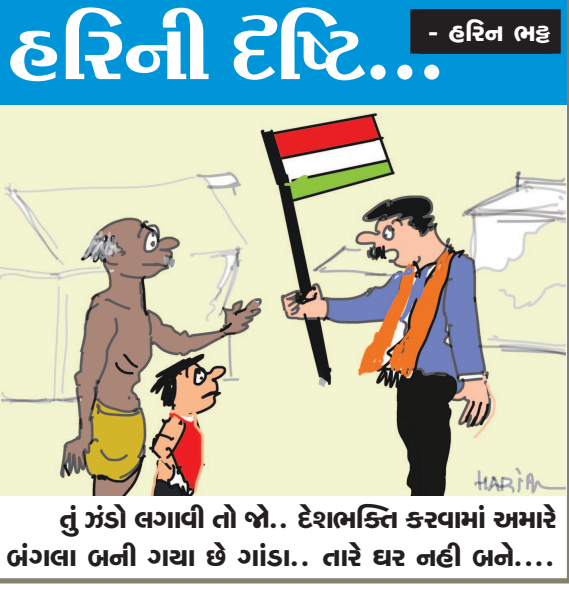
હું મંડો લગાવી તો બો... દેશભક્તિ કરવામાં અમારે બંગલા બની ગયા છે ગાંડા.. તારે ઘર નહી બને....