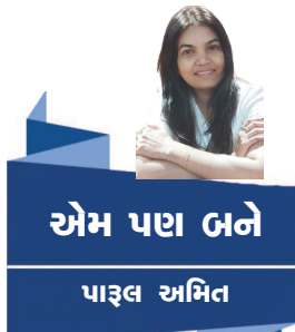
એમ પણ બને પાણ્ણ અમિત

એના ભૂખ્યા પેટ છતાં એને, કેવી મોંઘી તુ કેવી મીઠી એના બેડી બંધન તુટશે, એવી આશો ખલક બધી ખડી ! કેવું વર્ણન આ મહાન કવિ દ્વારા. શાસ્ત્ર અને શસ્ત્ર બન્ને અંગ્રેજો પર ભારે પડ્યા હતાં. કેટલાયે સ્વાતંત્ર્ય સેનાનીઓ એ ગુજરાતી,હિન્દી, બંગાળી, ઉર્દુ કેટલી ભાષામાં તો કારાવાસમાં કાવ્યો લખ્યા હતાં. જે પોતે જ એકતાનું એક જૂથ પરિબળ હતાં. દેશ અને દેશની આઝાદીને ખાતર કુરબાન થનારા સર્વે વીરો-શહીદોને કોટિ કોટિ નમન! આ આઝાદી નિમિતે મારુ એક કાવ્ય રજૂ કરું છું. થાય મન મોટા તો બધાં આઝાદ જ છે ગુલામ તો મન ના વિચારો થી જ છે, દેશ દાઝ શું? શરૂઆત પોતાનાથી જ છે, મુક્તિ ખુલ્લા મન ના આચરણ ની જ છે, દિલ સાફ તો દેશ ભક્તિ સાચી જ છે, ખરી સ્વતંત્રતા તો મનથી મુક્ત વિચારો ની છે, "પ્રેમ ભાવ પરસ્પર એ જ રાષ્ટ્ર ભાવના છે" "ભારત સુખી, સંપન્ન આઝાદ ત્યારે જ છે" શહીદોને સાચી સલામી શાન થી જ છે. આ દેહ ભારતની ભૂમિ ને નતમસ્તક છે.