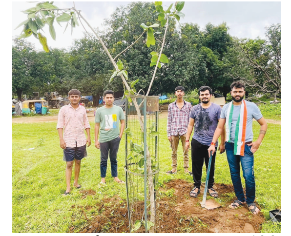
ભારતના પૂર્વ વડાપ્રધાન ભારતરત્ન સ્વ.રાજીવ ગાંધીની જન્મજયંતી નિમિત્તે ગાંધીનગર શહેર યુથ કોંગ્રેસ દ્વારા વડના વૃક્ષનું વાવેતર કરવામાં આવ્યું હતું.