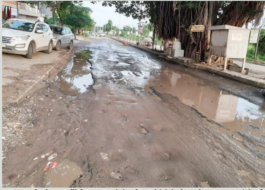
વરસાદે શહેરના માર્ગોને બિસ્માર બનાવી દીધા છે. સ્માર્ટસીટીની ઓળખ થોડાક જ વરસાદમાં ધોવાઈ ગઈ છે. શહેરની આસપાસના નવ વિકસીત વિસ્તારોના માર્ગોનો ડામર ઉપમી ગયો છે અને મસમોટા ખાડા પડી ગયા છે. શહેરના સરગાસણ વિસ્તારના આંતરિક માર્ગોની હાલત ખુબ જ બિસ્માર બની ગઈ છે.