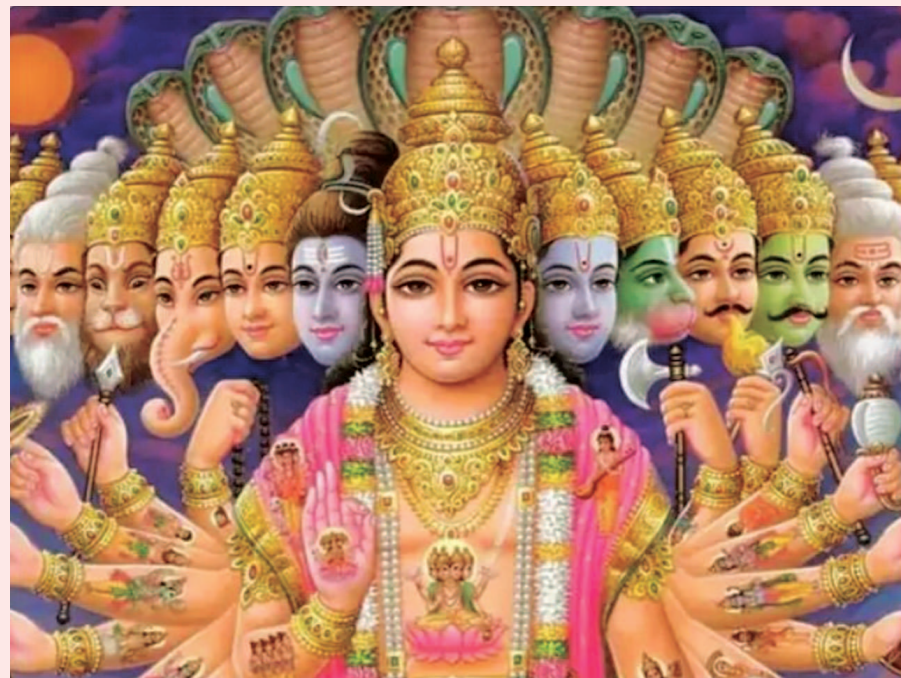
લક્ષ્મીની પ્રતિમાઓને સ્થાપિત કરવી, તે પછી શુદ્ધ સુગંધિત જળથી અભિષેક કરવો, ત્યારબાદ દક્ષિણવર્તી શંખમાં કેસર મિશ્રિત દૂધ ભરવું અને અભિષેક કરવો જોઈએ.

બંને પક્ષમાં એક-એક એકાદશી રહે છે. આ પ્રકારે ૧૨ મહિનામાં કુલ ૨૪ એકાદશી રહે છે. જે વર્ષ પંચાંગમાં અધિક માસ રહે છે તે વર્ષ દરમિયાન ૨૬ એકાદશી આવે છે. જે લોકો આખા વર્ષની બધી એકાદશીઓમાં વ્રત કરે છે. તેમને ધર્મલાભ સાથે જ સ્વાસ્થ્ય લાભ પણ મળે છે. એક મહિનામાં નોંધામાં ઓછા બે દિવસ નિરાહાર રહેવાથી પેટને લગતી પરેશાનીઓ દૂર થઈ શકે છે. ગેસ, એસિડિટી, અપચો, કબજિયાત વગેરે બીમારીઓને દૂર કરવા માટે પણ વ્રત લાભદાયક રહે છે. ભગવાન વિષ્ણુ સાથે લક્ષ્મીજીનું પૂજા કરવામાં આવે છે. સૌથી પહેલાં વિષ્ણુ-