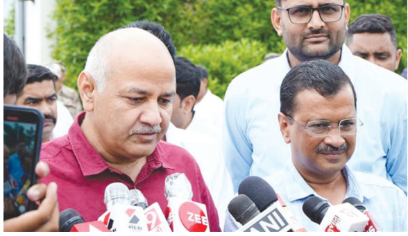
નીતિમાં કથિત કોભાંડ મામલે આમ આદમી પાર્ટી અને ભાજપ સામસામે આવી ગયા છે. બંને પાર્ટીના નેતાઓ સતત એકબીજા પર શાબ્દિક પ્રહારો કરી રહ્યા છે.

એકસાથ નીતિમાં કોભાંડમાં ભાજપ-આપ આમને-સામને : રાજપૂત છું, માથું કપાવી લઈશ પણ ભ્રષ્ટાચારીઓ-પડયંત્રકારીઓ સામે ઝુકીશ નહીં : મનિષ સિસોદિયા નવી દિલ્હી, તા. ૨૨ દિલ્હીની એકસાઈજ તેના અનુસંધાને દિલ્હીના નાયબ મુખ્યમંત્રી અને આપના નેતા મેસેજ મળ્યો હતો જેમાં એવું કહેવામાં આવ્યું હતું કે, તેઓ ભાજપમાં આવી જશે તો સીબીઆઈ-ઈડીના તમામ કેસ બંધ કરાવી દેવાશે. મનીષ સિસોદિયાએ દિવટમાં લખ્યું છે કે, 'મને ભાજપમાં સંદેશ મળ્યો- આપને તોડીને ભાજપમાં આવી જાઓ, તમામ સીબીઆઈ-ઈડીકેસ બંધ કરાવી દઈશું. મેં ભાજપને જવાબ આપ્યો- હું મહારાષ્ટ્ર પ્રતાપનો વંશજ છું, રાજપૂત છું. માથું કપાવી લઈશ પણ ભ્રષ્ટાચારીઓ-પડયંત્રકારીઓ સામે ઝુકીશ નહીં. મારી સામેના તમામ કેસ ખોટા છે. જે કરવું હોય એ કરી લો.'