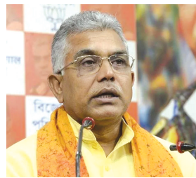
પોતાના સંબોધનમાં તેમણે દાવો કર્યો કે, ટીએમસીના અનેક નેતાઓને એ વાતનો ડર સતાવી રહ્યો છે કે, સીબીઆઈની જેમ ઈડીના અધિકારીઓ સાથે સેટિંગ નહીં કરી શકાય. તેમણે કહ્યું કે, આ જ કારણ છે કે, સીબીઆઈના કેટલાક અધિકારીઓને પશ્ચિમ બંગાળમાંથી હટાવી દેવામાં આવ્યા છે અને ઈડી દ્વારા તપાસ હાથ ધરવામાં આવી છે.

આ સેટિંગથી જ કોભાંડોની તપાસમાં પરિણામ ન આવ્યાનો ભાજપના રાષ્ટ્રીય ઉપાધ્યક્ષે કરેલો દાવો નવી દિલ્હી, તા. ૨૨ ભાજપના રાષ્ટ્રીય ઉપાધ્યક્ષ દિલીપ ઘોષે રવિવારે મોટું નિવેદન આપ્યું છે. તેમણે કોલકાતામાં કહ્યું કે, સીબીઆઈના કેટલાક અધિકારીઓનું તેણે સૂચના સાથે સેટિંગ હવે. તેની જાણકારી મળતા જ નાણા મંત્રાલયે ઈડીને પશ્ચિમ બંગાળમાં ભ્રષ્ટાચાર મામલે તપાસ કરવા માટે મોકલ્યા હતા. પશ્ચિમ બંગાળની રાજધાની કોલકાતામાં સ્થિત આઈસીસીઆરમાં કેન્દ્રીય સંસ્કૃતિ મંત્રાલય દ્વારા આયોજિત એક કાર્યક્રમને સંબોધિત કરતા ઘોષે કહ્યું કે, કેટલાક સીબીઆઈ અધિકારીઓ અને અને ટીએમસી વચ્ચેના આ સેટિંગને કારણે જ કોલસા કોભાંડ, પશુઓની દાણચોરીના કેસ અને શાળાની નોકરીઓમાં અનિયમિતતાઓની તપાસમાં પરિણામ નહોતું આવ્યું જેના કારણે ઈડીને ત્યાં મોકલવામાં આવી હતી. તેમણે કહ્યું કે, સીબીઆઈના કેટલાક અધિકારી ટીએમસી નેતાઓના હાથે વેચાઈ ચૂક્યા છે. પોતાના સંબોધનમાં તેમણે દાવો કર્યો કે, ટીએમસીના અનેક નેતાઓને એ વાતનો ડર સતાવી રહ્યો છે કે, સીબીઆઈની જેમ ઈડીના અધિકારીઓ સાથે સેટિંગ નહીં કરી શકાય. તેમણે કહ્યું કે, આ જ કારણ છે કે, સીબીઆઈના કેટલાક અધિકારીઓને પશ્ચિમ બંગાળમાંથી હટાવી દેવામાં આવ્યા છે અને ઈડી દ્વારા તપાસ હાથ ધરવામાં આવી છે.