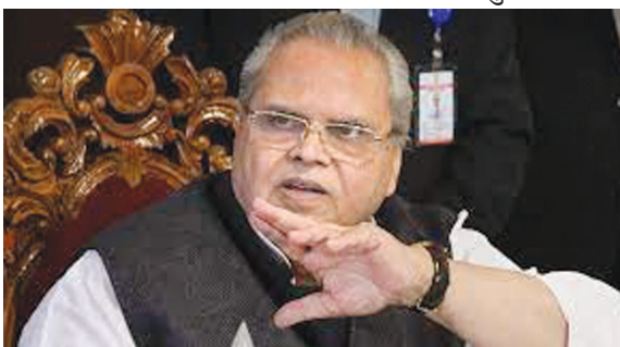
તેમણે કહ્યું કે તેમને આ દેશના ખેડૂતોને હરાવી શક્યો નહીં. તમે તેમને ડરાવી નહીં શકો. કેમ કે તેમને ઈડી કે ઈકમ ટેક્સ અધિકારી મોકલી શકતા નથી તો તેમને ખેડૂતોને આવી રહ્યું કેમ કે વડાપ્રધાનના એક મિત્ર છે જેમનું નામ અદાણી છે. તેઓ અત્યારે પાંચ વર્ષમાં એશિયાના સૌથી અમીર વ્યક્તિ બની ગયા છે.

જો એમએસપી લાગુ કરવામાં આવે નહીં અને કાયદેસર ગેરંટી આપવામાં નહીં આવે તો વધુ એક લડત થશે નવી દિલ્હી, તા. ૨૨ ખેડૂતોને લઘુત્તમ ટેકાના ભાવ (એમએસપી)ની કાયદેસર ગેરંટીના મુદ્દે મેઘાલયના રાજ્યપાલ સત્યપાલ મલિકે એકવાર ફરી કેન્દ્ર સરકાર પર નિશાન સાધ્યું છે. તેમણે કહ્યું કે દેશના ખેડૂતોને હરાવી શકાય નહીં અને જ્યાં સુધી તેમની માગ પૂરી નહીં થાય ત્યાં સુધી તેઓ પોતાનો વિરોધ ચાલુ રાખશે. નૂહમાં એક કાર્યક્રમમાં બોલતા સત્યપાલ મલિકે કહ્યું કે જો એમએસપી લાગુ કરવામાં આવી નહીં અને આની પર કાયદેસર ગેરંટી આપવામાં આવી નહીં તો વધુ એક લડત થશે અને આ વખતે ભયંકર લડત થશે. કેવી રીતે ડરાવવો. એમએસપી એટલા માટે લાગુ નથી કરવામાં