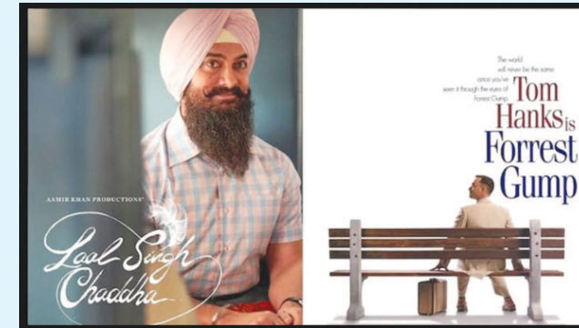
'ફોરેસ્ટ ગમ્પ'નું આ ભારતીયકરણ કોઈ રીતે આવકારદાયક નથી. 'લાલસિંહ ચઢ્યા' આમીરખાનની ફિલ્મ ભલે હોય પણ આમીરખાન જ ફિલ્મનું સૌથી નબળું પાસું છે.

લાલસિંહ સૈન્યમાં ભરતી થયો છે, એની બહાદુરી માટે એને વીરચક્ર પણ મળે છે. કારગીલની લડાઈ વખતે એ એક પાકિસ્તાની સૈનિકને ઉઠાવી લાવે છે અને એને એ ખબર પણ નથી કે એ કોને ઉઠાવી લાવ્યો છે. મૂળ ફિલ્મના પાત્રમાં જે નિર્દોષતા અને ભોળપણ હતું એ અહીં મૂર્ખતામાં પરિણમે છે. ગોળી વાગી છે કે મધમાખી કરડી છે એ પણ લાલસિંહ ન સમજતો હોય તો સૈન્યમાં એની ભરતી થઈ કેવી રીતે ? આમ, તાર્કિક રીતે પણ ફિલ્મ સામે ઘણા પ્રશ્નો ઊભા થાય એમ છે. કરીના કપૂરના ભાગે પણ ખાસ કશું કરવાનું આવ્યું નથી. લાલસિંહના પ્રેમનો એ આખરે સ્વીકાર કરે છે. પણ ત્યારે બહુ મોડું થઈ ગયું હોય છે. અભિનયની રીતે લાલસિંહની માતાની ભૂમિકા ભજવનાર મોના સિંહ અને મહોબમદ મિયાની ભૂમિકા ભજવનાર માનવ વિજ યાદ રહી જાય છે. ફિલ્મમાં સૈન્યની અંદર લાલસિંહનો મિત્ર બાલા (નાગા ચૈતન્ય) ની સાથે યડી - બનિયાન બાવાવાની વાત પણ ખંચાઈ છે અને ફિલ્મના કંટાળામાં વધારો કરે છે.