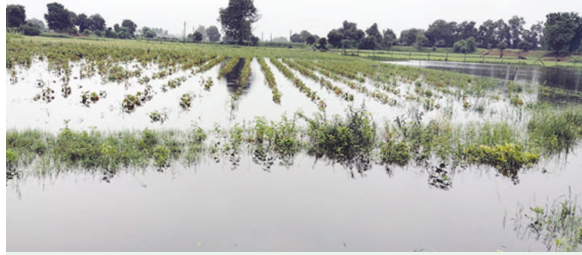
જિલ્લામાં ખરીફ વાવેતર

બાયડ (બ્યુરો ઓફિસ), તા. ૨૫ સાબરકાંઠા, અરવલ્લી જિલ્લામાં સતત વરસાદ હવે ખેડૂતોની ચિંતા વધારી છે.