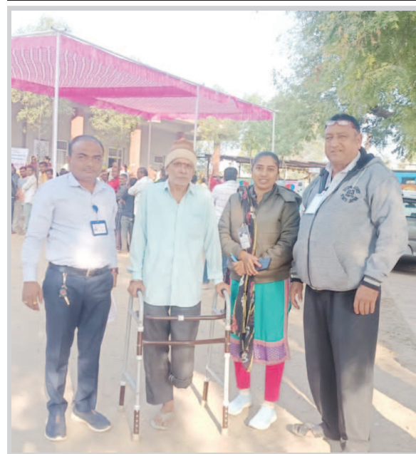
ગુજરાત વિધાનસભાની સામાન્ય ચુંટણીઓમાં બીજા તબક્કાના મતદાનમાં ગાંધીનગર જિલ્લાની પાંચેય બેઠકો માટે સોમવારે મતદાન યોજાયું હતું જેમાં જિલ્લાના ગ્રામીણ વિસ્તારમાં મતદારોએ ખૂબ ઉત્સાહપૂર્વક મતદાન કર્યું હતું. કલોલ તાલુકાના કાંડા ગામે સરકારી પ્રાથમિક શાળામાં યોજાયેલા મતદાનમાં દિવ્યાંગ મતદારોએ પણ મતદાનને પોતાની ફરજ સમજી મતદાન કર્યું હતું.

સુત્રો દ્વારા મળતી વિગત મુજબ વિધાનસભાની ચુંટણીપૂર્વે