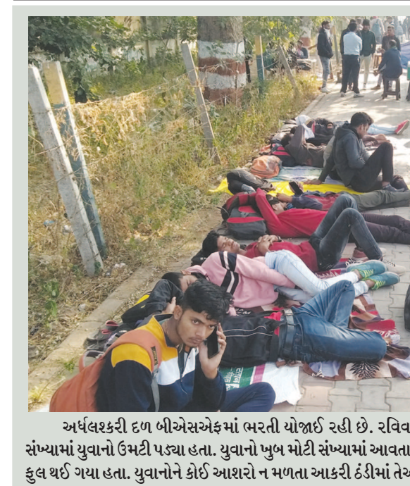
અર્ધશકરી દળ બીએસએફમાં ભરતી યોજાઈ રહી છે. રવિવારે આ ભરતીમાં ભાગ લેવા માટે મોટી સંખ્યામાં યુવાનો ઉમટી પડ્યા હતા. યુવાનો ખુબ મોટી સંખ્યામાં આવતા શહેરની તમામ હોટલો અને ગેસ્ટહાઉસ ફુલ થઈ ગયા હતા. યુવાનોને કોઈ આશરો ન મળતા આકરી ઠંડીમાં તેઓ ફૂટપાથ પર સુવા મજબૂર બન્યા હતા.

માટીને દૂર કરાવાઈ હતી અને ત્યારબાદ અન્ય શ્રમિકો દ્વારા બંને મજૂરોને બહાર સહીસલામત બહાર કાઢવામાં આવ્યાં હતા. અચાનક સર્જાયેલી આ ઘટનામાં સદભાગ્યે કોઈ જાનહાની થઈ નથી અને મોટી દુર્ઘટના ટળી હતી પરંતુ આ ઘટનાને કારણે ફરી એકવાર શહેરમાં ચાલી રહેલા વિકાસ કાર્યોમાં સુરક્ષા અને સલામતી બાબતે બેદરકારી દાખવાથી હોવાનું નાગરિકોમાં ગણગણાટ શરૂ થઈ ગયો હતો. અંતે ઉલ્લેખનીય છે કે વાવોલમાં ચાલી રહેલા ગટર લાઈન નાખવાના કાર્યમાં ગટર લાઈનની પાઈપની સાઈઝ, પાઈપલાઈનની ઊંડાઈ બાબતે નાગરિકોમાં અસંતોષ અને શ્રમિકોની સલામતી અને સુરક્ષા માટે આધુનિક ઉપકરણોના ઉપયોગનો અભાવ જેવી બાબતો અંગે ભારે બેદરકારી સેવામાં આવતી હોવાનો સ્થાનિકોમાં મત જોવા મળે છે.