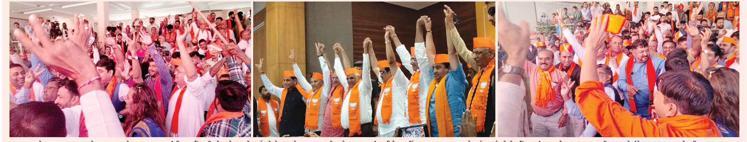
જીતનો જશ્ન - કમલમ ખાતે ભાજપના પ્રદેશ પ્રમુખ, મુખ્યમંત્રી, પદાધિકારીઓ અને હજારો કાર્યકરોએ જીતનો જશ્ન મનાવ્યો હતો... ભાજપનું માર્ક ધ્વાનીંગ, આક્રમક પ્રચાર અને કમળ કાર્યકરોનો પરિશ્રમ રંગ લાવ્યો... ભારત માતાકી જય અને વંદે માતરમ્ના જયઘોષથી વાતાવરણ ગાજી ઉઠ્યું હતું...

હતા. ૧૨ ડિસેમ્બરના રોજ અમદાવાદ નરેન્દ્ર મોદી સ્ટેડિયમ ખાતે નવી સરકારની શપથવિધિ સમારોહની જાહેરાત કરાઈ છે. ગુજરાતમાં ભાજપના ભવ્ય જીતના પરચમ લહેરાવાનાર સીઆર પાટીલે જાહેરાત કરી કે, ૧૨ ડિસેમ્બરે, સોમવારે ગાંધીનગરમાં બપોરે ૨ વાગે હેલિપેડ ડ્રાઉન્ડ પર શપથવિધિ સમારોહ યોજાશે. પીએમ નરેન્દ્ર મોદી અને ગૃહમંત્રી અમિત શાહ શપથવિધિ સમારોહમાં હાજર રહેશે. ૧૨મીએ ભૂપેન્દ્ર પટેલ જ મુખ્યમંત્રી પદના શપથ લેશે.