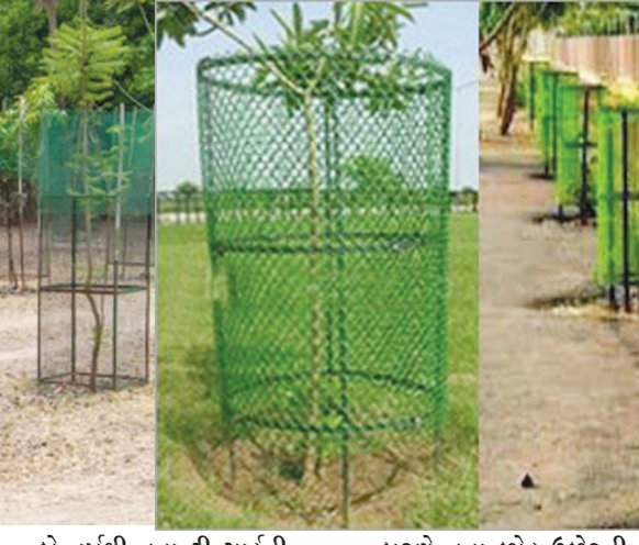
યોમાસા દરમ્યાન જે છોડ ઉછેરવામાં આવ્યા હતા તેની કચરો નવા ટ્રી ગાર્ડ લગાવવા કરતે જૂના ટ્રી ગાર્ડ ઝડપથી