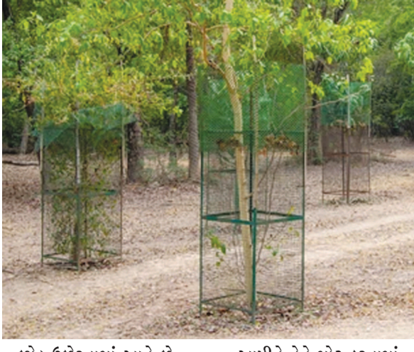
છોડ ઉછેરવામાં આવે છે. નવા છોડને ટ્રી ગાર્ડથી રક્ષણ આપીને તેને મોટું કરવામાં આવે છે. જો કે શહેરમાં છેલ્લા બે વર્ષથી નવા ટ્રી ગાર્ડની અછત વર્તાઈ રહી છે. જેના કારણે નવા છોડ ઉછેરની કામગીરી મંદ પડી છે.

ગાંધીનગર, તા. ૧૧ ગાંધીનગરને વધુ હરિયાળું બનાવવા દર વર્ષે નવા છોડ ઉછેરવામાં આવે છે. પરંતુ નવા ટ્રી ગાર્ડની અછત હોવાથી નવા છોડેલા છોડનું બાળમરણ થઈ રહ્યું છે. છેલ્લા બે વર્ષથી શહેરમાં નવા ટ્રી ગાર્ડ લગાવવામાં આવ્યા ન હોવાથી નવા છોડ ઉછેરવાની કામગીરી ધીમી પડી છે.