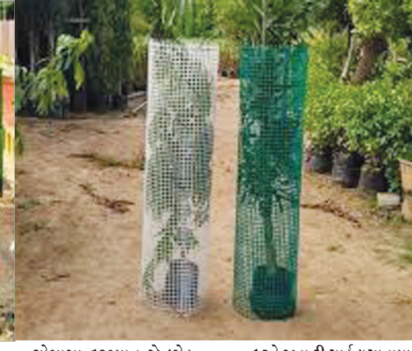
તુટી જતાં હોવાથી નવા છોડને લાકડાં નો પશુઓ નુકશાન પહોંચાડે છે. લગભગ અડધાથી વધુ નવા છોડ આ રીતે નાશ પામી રહ્યા છે અને છોડવાઓ ઉછેરવાનો ખર્ચ માથે પડે છે. દર વર્ષે વન વિભાગ અને મનપા દ્વારા ટ્રી ગાર્ડ ખરીદીને નવા છોડની ફરતે લગાવવામાં આવે છે. પરંતુ છેલ્લા બે વર્ષથી આ કામગીરી કોઈ કારણસર થઈ નથી. જેના કારણે શહેરને વધુ હરિયાળું બનાવવાની કામગીરી ધીમી પડી ગઈ છે.