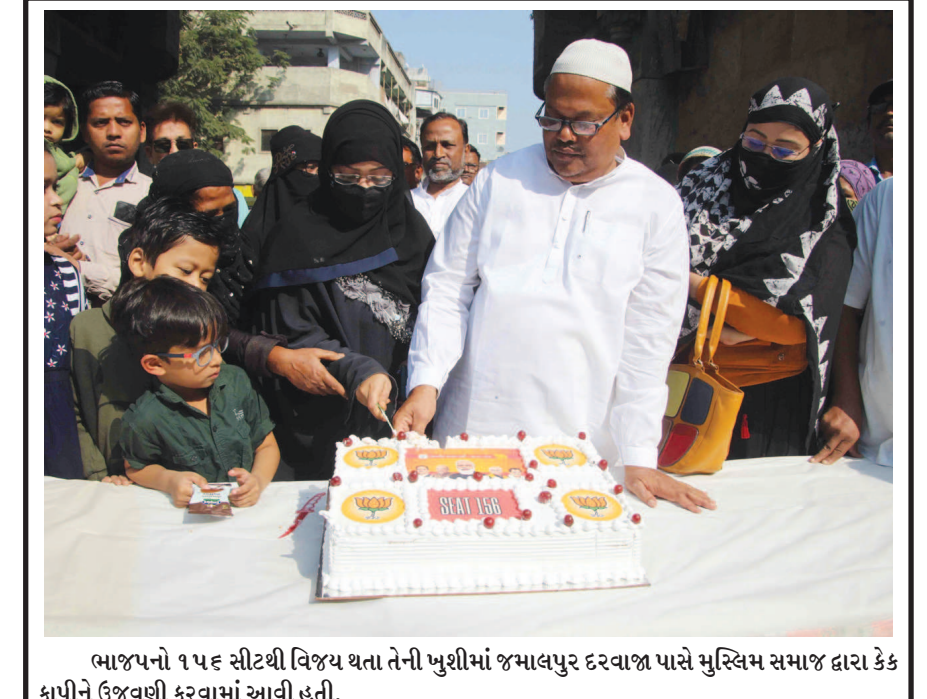
ભાજપનો ૧૫૬ સીટથી વિજય થતા તેની ખુશીમાં જમાલપુર દરવાજા પાસે મુસ્લિમ સમાજ દ્વારા કેક કાપીને ઉજવણી કરવામાં આવી હતી.

અમદાવાદ/ન્યૂયોર્ક, તા. ૧૧ સંયુક્ત રાષ્ટ્રનું હેડક્વાર્ટર્સ ન્યૂયોર્ક, અમેરિકામાં બીએપીએસ સ્વામીનારાયણ સંસ્થાના પ્રમુખ સ્વામીજી મહારાજની જન્મશતાબ્દી સમારંભ અને દેશમાં ચાલી રહેલા આઝાદીના અમૃત મહોત્સવનું સંયુક્ત રીતે આયોજન કર્યું હતું.