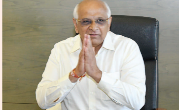
મુખ્યમંત્રી ભૂપેન્દ્ર પટેલ

ગાંધીનગર, તા. ૧૩ રાજ્યના વહીવટી તંત્રને ગતિશીલ ઝડપી અને પારદર્શક બનાવવા માટે રાજ્ય સરકારે સચિવાલયથી લઈને તાલુકા કક્ષા સુધીની સરકારી કચેરીઓમાં કામગીરી ઓફલાઈન જે થતી હતી તેમાં રાજ્ય સરકાર હવે સરકારી કચેરીઓને પેપર લેસ બનાવવા માટે નવી ઈ-સરકાર એપ્લિકેશન સરકારી કચેરીઓમાં શરૂ કરી છે. રાજ્યમાં સચિવાલયના વડાઓની કચેરીઓથી લઈને તાલુકા કક્ષા સુધીની સરકારી કચેરીઓને જીસવાન નેટવર્કથી જોડવામાં આવ્યું છે અને તમામ સરકારી કચેરીઓમાં ઓનલાઈન વહીવટી કામગીરી માટે iwtdms એપ્લિકેશન અત્યાર સુધી અમલી કરવામાં આવી હતી.