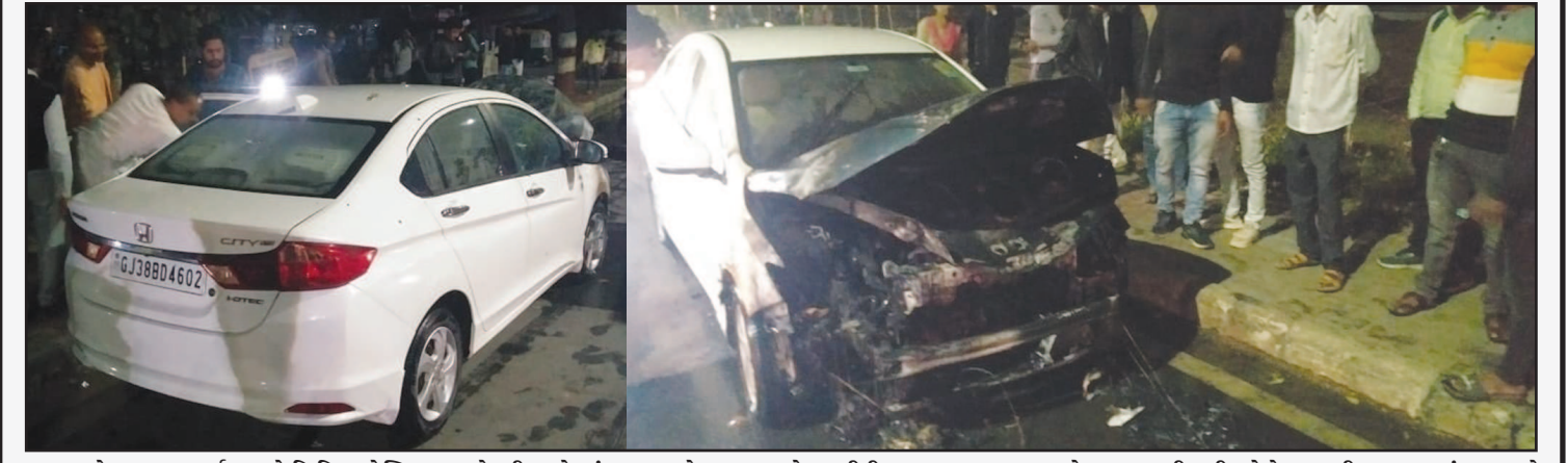
શહેરના ઘ-૩ સર્કલ પાસે સિવિલ હોસ્પિટલના ગેટની સામે સાંજના સમયે અચાનક હોન્ડા સીટી કારના આગળના ભાગે આગ લાગી હતી. જોકે ગણતરીના સમયમાં જ કારનો એન્જીન સહિતનો ભાગ બળીને સ્વાહા થઈ ગયો હતો. જ્યારે બનાવની જાણ ફાયર ટીમને થતા તાત્કાલીક પહોંચીને પાણીનો મારો ચલાવી આગ પર કાબુ મેળવી લીધો હતો. જ્યારે સાંજના સમયે કારમાં આગ લાગતા સ્થાનિક નાગરીકો મોટીસંખ્યામાં એકઠા થઈ ગયા હતા. જ્યારે આ બનાવમાં કોઈ જાનહાની થવા પામી ન હતી.