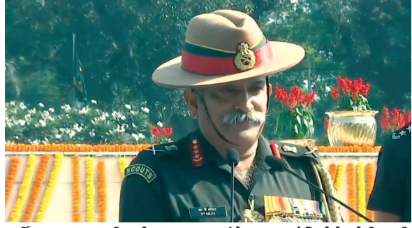
પૂર્વીય કમાન્ડના ચીફ લેફ્ટનન્ટ જનરલ આર.પી. કલિતાએ કહ્યું બંને પક્ષના સૈનિકોને થોડી ઘણી ઈજાઓ પહોંચી છે. તેમજ હવે

તવાંગમાં ચીનના સૈન્ય સાથેની અથડામણ પર નિવેદન : ચીનની સૈન્યએ એલએસી પાર કરતા તેના લીધે અથડામણ થતા બંને પક્ષના સૈનિકોને થોડી ઘણી ઈજાઓ પહોંચી છે નવી દિલ્હી, તા. ૧૬ અરુણાચલ પ્રદેશના તવાંગ ક્ષેત્રમાં ચીનની સૈન્ય સાથેની અથડામણ બાદ ભારતીય સેનાના કે, આપણા દેશની સુરક્ષા માટે સેના હંમેશા તૈયાર છે. ચીનની સૈન્યએ એલએસી પાર કરી લીધું હતું તેના લીધે અથડામણ થતા ત્યાંની સ્થિતિ નિયંત્રણમાં થઈ ગઈ છે. પૂર્વીય કમાન્ડના વડા કલિતાએ કહ્યું કે, એક સૈનિક તરીકે અમે હંમેશા દેશની રક્ષા માટે તૈયાર છીએ, પછી તે શાંતિનો સમય હોય કે સંઘર્ષનો સમય હોય. આપણું મૂળ કામ દેશની સરહદને કોઈપણ વિદેશી કે આંતરિક ખતરાથી અકબંધ રાખવાનું છે.