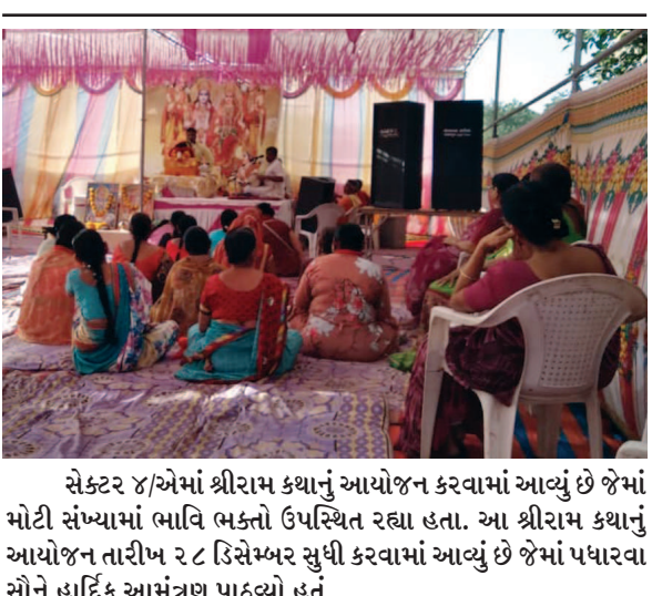
સેક્ટર ૪/એમાં શ્રીરામ કથાનું આયોજન કરવામાં આવ્યું છે જેમાં મોટી સંખ્યામાં ભાવિ ભક્તો ઉપસ્થિત રહ્યા હતા. આ શ્રીરામ કથાનું આયોજન તારીખ ૨૮ ડિસેમ્બર સુધી કરવામાં આવ્યું છે જેમાં પધારવા સૌને હાર્દિક આમંત્રણ પાઠવ્યું હતું.