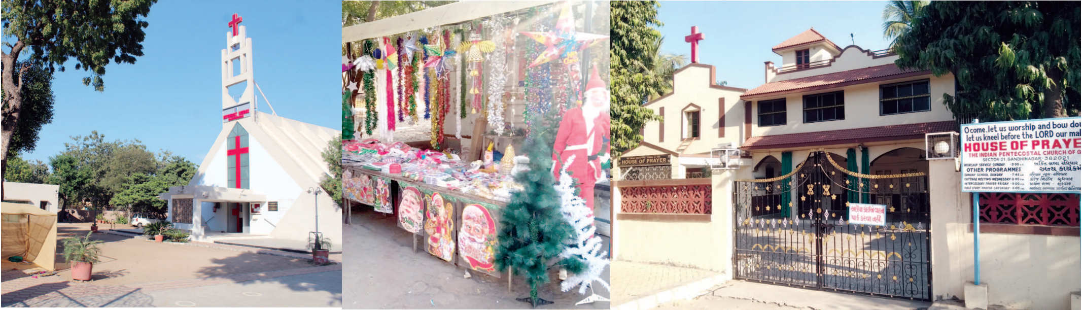
નાતાલ પર્વની ઉજવણીને હવે ગણતરીના જ દિવસો બાકી રહ્યા છે ત્યારે ગાંધીનગરમાં આવેલી ચર્યને શણગારવાની કામગીરી ચાલુ કરાઈ છે. ચર્યને રોશનીથી શણગારતા આકર્ષણનું કેન્દ્ર બની ઉઠશે. ચર્યની બહાર-અંદર ખ્રિસ્તી સમાજના યુવા વર્ગ દ્વારા રોશની અને અલગ અલગ પ્રકારના સુશોભનની કામગીરી વેગવંતી બની છે. ક્રિસમસ ટ્રી સાથે સ્ટારનો આકર્ષક શણગાર થઈ રહ્યો છે. ચર્ય સત્રી દરમિયાન રોશનીનું આ શણગારથી ઝળહળી ઉઠશે.