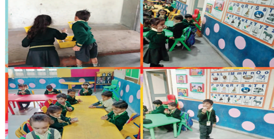
ગાંધીનગર, તા.૨૦ સર્વ વિધ્યાલય કેળવણી મંડળ દ્વારા સંચાલિત એસ. કે. પટેલ કે.જી. ઈંગ્લિશ મીડિયમ સ્કૂલમાં ન્યુઝ પેપર પેપરના બોલ બનાવવાની જુદા જુદા એ. બી. સીના અક્ષરો પર, નંબર પર, સ્પેલિંગ પર, શેપ પેપર બોલ શ્રો કરીને શિક્ષિકાઓએ બાળકોને રમત રમત માં એ. બી. સી ના અક્ષરો, નંબરઓ, શેપસ વગેરેની ઓળખાણ કરાવી હતી. જેમાં નાના નાના ભૂલકાં ઓએ ન્યુઝ પેપર પરમાંથી બનાવેલા બોલ શ્રો કરીને બાળકોએ અદભૂત આનંદ પ્રાપ્ત કર્યો હતો.