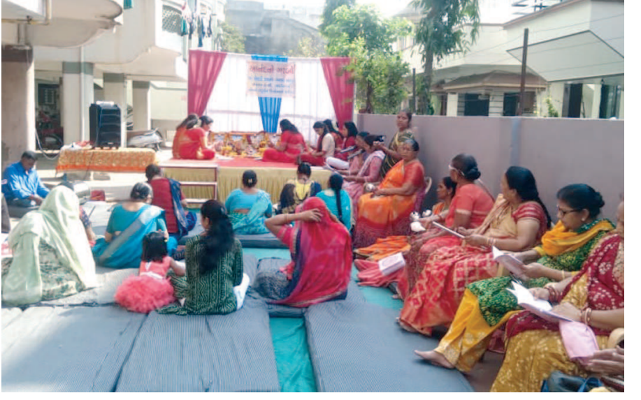
માં મેલડી આનંદ ગરબા મંડળ દ્વારા આનંદનો ગરબો યોજાયો હતો જેમાં મહિલાઓએ શ્રધ્ધા પૂર્વક આનંદના ગરબા નો લાભ લીધો હતો

સહજાનંદ સ્કુલ ઓફ એચીવર ચિલોડા ખાતે ક્રિસમસની ઉજવણી કાર્યક્રમનું આયોજન કરવામાં આવેલું હતું. જેમાં શાળાના બાળકોને શાન્તાકલોઝ બનીને વિવિધ કાર્યક્રમોમાં ભાગ લીધો હતો તેમજ શોલો ડાન્સનું આયોજન કરવામાં આવ્યું હતું. જેમાં બાળકો એ ખુબ રસ બતાવ્યો હતો. અને બાળકો ખુબ જ ખુશ થઈ ગયા હતા.