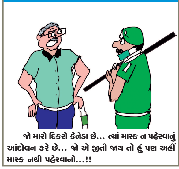
જો મારો દિકરો કેનેડા છે... ત્યાં માર્ક ન પહેરવાનું આંદોલન કરે છે... જો એ જીતી જાય તો હું પણ અહીં માર્ક નથી પહેરવાનો...!!