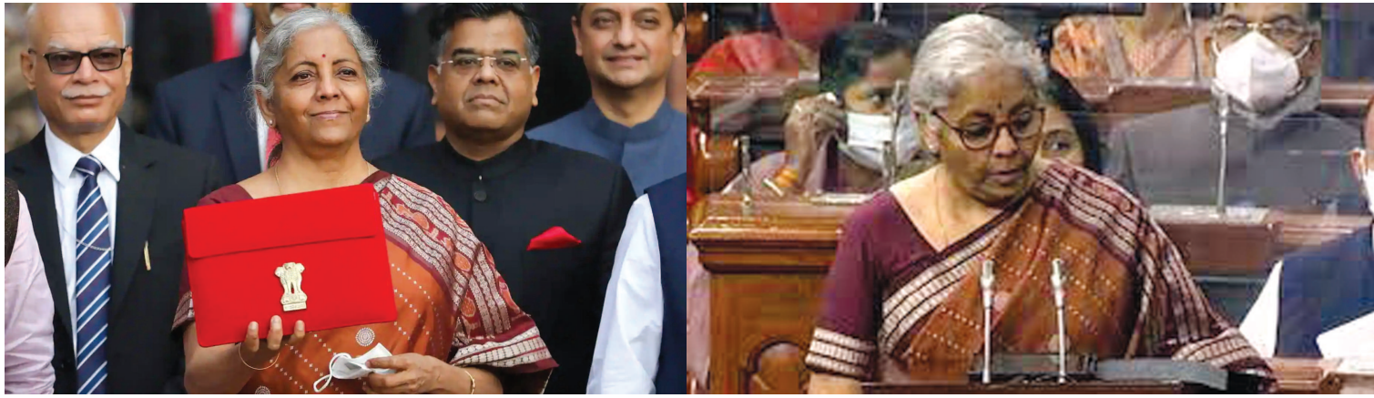
નિર્મલા સીતારમણ દ્વારા રજૂ કરી દેવાયું છે. જેમાં ૪૦૦ નવી વંદે ક્રિપ્ટોકરન્સી લોન્ચ કરવાની જાહેરાત કરાઈ છે. એજ્યુકેશન

નવી દિલ્હી, તા. ૧ દેશનું વર્ષ ૨૦૨૨-૨૩નું સામાન્ય બજેટ આજે નાણાંમંત્રી ભારત દ્વેનો શરૂ કરવા ઉપરાંત, ૨૫,૦૦૦ કિમીના હાઈવે બનાવવાની તેમજ રિઝર્વ બેંક દ્વારા સેને પણ હવે સરકાર ડિજિટલ બનવા માગે છે, જેના ભાગરૂપે ડિજિટલ યુનિ. તેમજ સ્કૂલના બનાવવા પ્રયાસો શરૂ કર્યા છે, અને એર ઈન્ડિયાના વેચાણ બાદ એલઆઈસીનો આઈપીઓ કરાઈ. બહુચર્ચિત ક્રિપ્ટોકરન્સીમાં ફેરફારને કારણે લેધરની ખેતીનો સામાન અને પોલિશ્ડ આઈટમ્સ, કપડાં, મોબાઈલ ડ્યૂટીના દરોમાં કરવામાં આવેલા ફેરફારને કારણે લેધરની ડાયમેન્ડ તેમજ જેમ્સ પણ સસ્તાં થશે. આ ઉપરાંત, ખેતીનો સામાન અને પોલિશ્ડ આઈટમ્સ, કપડાં, મોબાઈલ ડ્યૂટીના દરોમાં કરવામાં આવેલા ફેરફારને કારણે લેધરની ડાયમેન્ડ તેમજ જેમ્સ પણ સસ્તાં થશે. અત્યાર સુધી ભારતમાં ક્રિપ્ટોકરન્સીના ટ્રેડિંગમાં થતી અનુસંધાન પાન-૭ પર