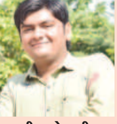
મીત કોયાણી સર્વ નેતૃત્વ ગુપ