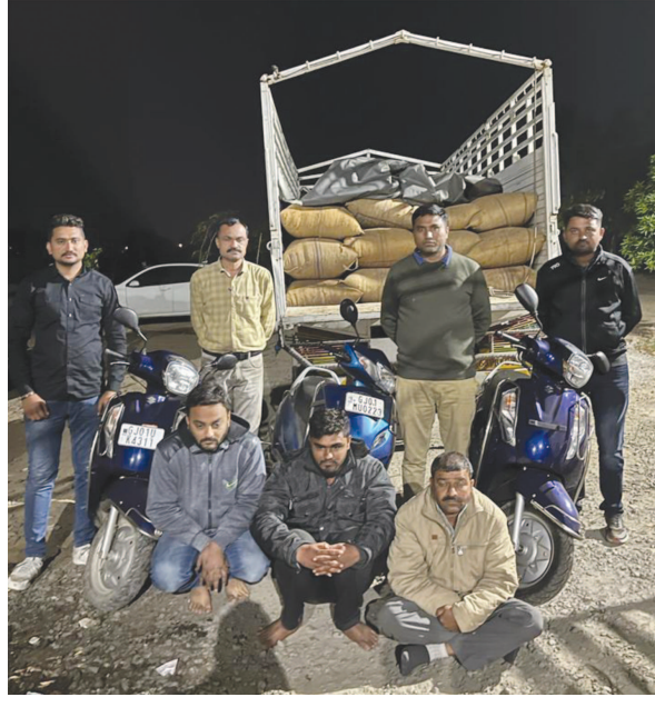
એલસીબી પોલીસે ઝડપી પાડ્યો છે. આ છેલ્લા બે મહિનાથી બિયરની કુલ બોટલ નંગ. ૬૭૪૬ મળી કુલ રૂ. ૨૮.૬૨ લાખનો

ગાંધીનગર, તા. ૨ ગાંધીનગર જિલ્લાના વડસર જીઆઈડીસી વિસ્તારમાંથી વિદેશી દારૂ-બિયરનો મોટીસંખ્યામાં જથ્થો દારૂનું ગોડાઉન ધમધમતુ હતું. ત્યારે એલસીબી-૨ પોલીસે વડસર ખાતે રેઈડ પાડતા જ સાંતેજ પોલીસ રાત્રીના સમયે આવી પહોંચી હતી. પોલીસે દારૂ-મુદામાલ કબ્જે કરી ત્રણ શખ્સોને પોલીસે પકડી પાડ્યા છે.