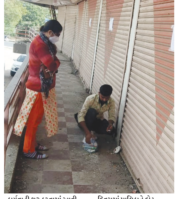
કાર્યવાહી શરૂ કરવામાં આવી છે. ગત રોજ બાયડના વાતક

બોલાવવામાં આવી છે. અસંખ્ય ધંધાના સ્થળો સીલ કરાયા છે. બાયડ નગરપાલિકા દ્વારા વારંવારના રીમાઈન્ડર છતાં લાંબા સમયથી બાકી વેરો નહીં ભરતા ૧૦૦૦થી વધુ બાકીદારોને અંતિમ નોટિસ