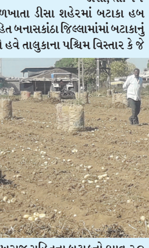
૨૬૦ થી ૩૦૦ મણનો ઉતારો આવ્યો હતો ત્યાં ચાલુ વર્ષે ૨૨૫ થી ૨૨૫ મણનો ઉતારો આવી રહ્યો છે. બટાકા કાઢવાની શરૂઆત થઈ છે ત્યારે પોખરાજ સહિત બટાકાના ૨૦ કિલોનો ભાવ રૂ. ૧૭૦ થી ૨૦૦ ની રેન્જમાં ચાલી રહ્યા છે. આગામી દિવસોમાં આ ભાવમાં કોઈ મોટો વધારો થાય તેવી શક્યતાને ખેડુતો નકારી રહ્યા છે. ગત વર્ષે ખેડુતોને બટાકાના ભાવમાં મોટું નુકશાન સહન કરવાનો વારો આવ્યો હતો અને હજુ પણ કેટલાય ખેડુતોના બટાકા કોલ્ડ સ્ટોરેજમાં પડ્યા છે અને નાણુકે રૂ. ૨૦ થી ૧૦૦ માં વેચવાની પણ ફરજ પડી છે. મોંઘી દવા, ખાતર અને બિયારણ લાવ્યા પછી હવે જ્યારે બટાકા કાઢવાની શરૂઆત થઈ છે ત્યારે ખેડુતોને ઓછો ઉતારો ચિંતા ઉપજાવે છે.

બટાકા નગરી તરીકે ઓળખાતા ડીસા શહેરમાં બટાકા હબ તરીકે પણ ઓળખાય છે ડીસા સહિત બનાસકાંઠા જિલ્લામાં બટાકાનું વાવેતર કરવામાં આવ્યું હતું અને હવે તાલુકાના પશ્ચિમ વિસ્તાર કે જે બટાકાનો હબ ગણાય છે ત્યાં નવા બટાકા કાઢવાના શ્રીગણેશ કરવામાં આવ્યા છે. ચાલુ વર્ષે શિયાળામાં વારંવાર થયેલા માવઠાના કારણે બટાકા પાક ને પણ નુકશાન થયું છે અને કુંજરાના રોગ ના કારણે વિસ્તારોમાં બટાકામાં કાળા ડાઘ પડી ચુક્યા છે. ગત વર્ષે કુંદરતી આકંઠના કારણે ઉતારો ઓછો આવ્યો હતો ત્યાં ચાલુ વર્ષે ૨૨૫ થી ૨૫૦ મણનો ઉતારો આવી રહ્યો છે. પોખરાજ સહિતના બટાકાનો ભાવ ૨૦ કિલોનો ભાવ હાલ ૧૭૦ થી ૨૦૦ ની રેન્જમાં ચાલી રહ્યો છે. શિયાળામાં સમયાંતરે થયેલા કમોસમી વરસાદના કારણે બટાકાની ખેતીમાં ખેડુતોને નુકશાન સહન કરવાની નોબત આવી છે અને વીધા દીઠ ૩૦ થી ૫૦ મણ ઓછો ઉતારો આવે તેવા અંદાજ લગાવવામાં આવી રહ્યો છે. ડીસા તાલુકાના હેડક્ટરમાં ખેડુતોએ બટાકાનું વાવેતર કર્યું હતું અને હાલ