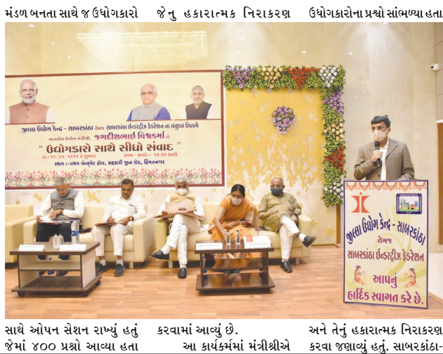
સાથે ઓપન સેશન રાખ્યું હતું જેમાં ૪૦૦ પ્રશ્નો આવ્યા હતા