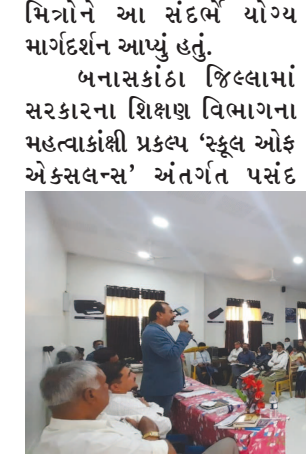
થયેલી શાળાઓમાં શૈક્ષણિક ગુણવત્તા અપગ્રેડ કરવા બાબતે આપતા ડા.આચાર્ય, બી.આર.સી. કો-ઓર્ડીનેટર તેમજ તાલુકા પ્રાથમિક શિક્ષણાધિકારીઓને