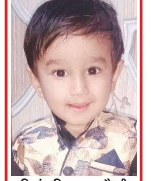
વિગ્નાંશ વિષયકુમાર ગોધરી સાંઈ વિલા સોસાયટી બાયડ