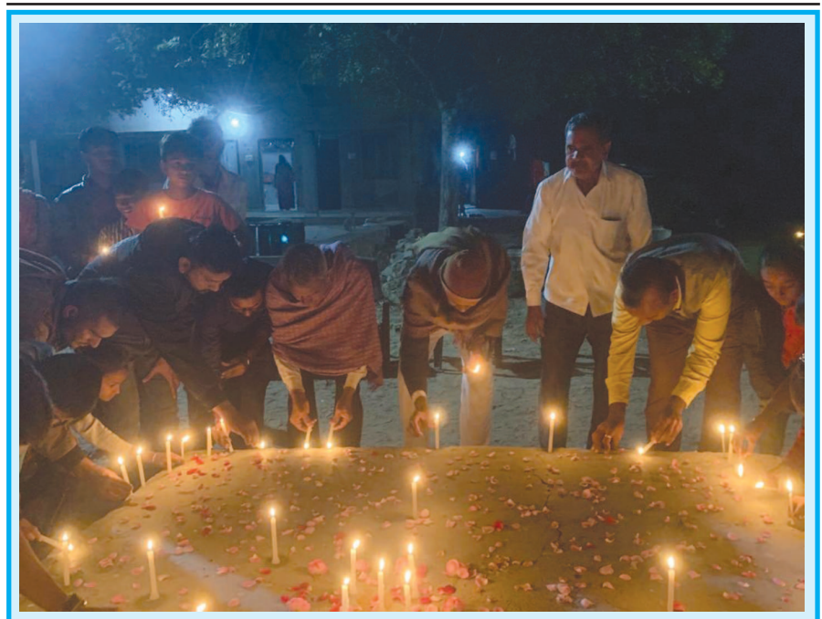
માલવણ શાળામાં પુલવામાના શહીદોને શ્રદ્ધાંજલિ

સરડોઈ તા. ૧૫ મોડાસા તાલુકાના સરડોઈ ગામે શ્રી ચામુંડા ચેહર ભવાની મંદિરનો પ્રાણ પ્રતિષ્ઠા મહોત્સવ ધામધૂમથી ઉજવવામાં આવ્યો હતો.આ પ્રસંગે સંતો, મહંતોનું સામૈયું કરી ભવ્ય શોભાયાત્રા