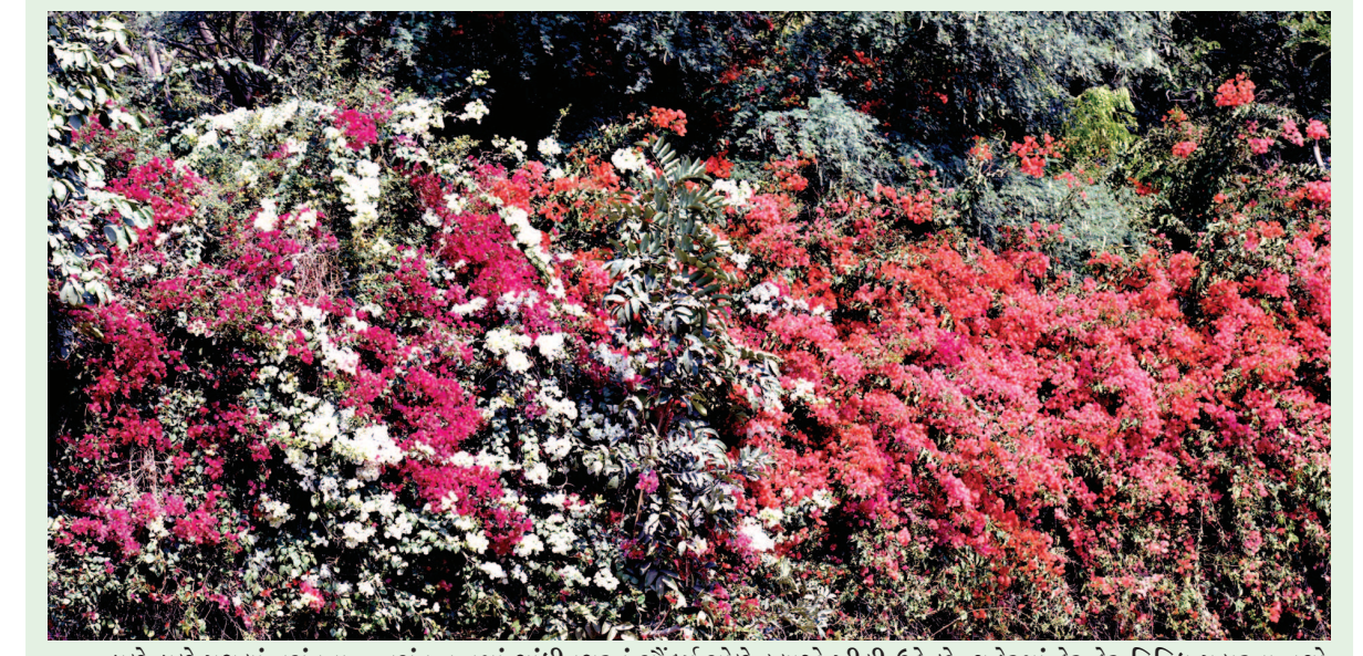
ડાળે ડાળે પગલાં વસંતના... વસંત ઋતુમાં ગાંધીનગરનું સૌંદર્ય સોળે કલાએ ખીલી ઉઠે છે. શહેરમાં ઠેર ઠેર વિવિધ પ્રકારના વૃક્ષો ઉછેરવામાં આવ્યા છે. વેલા અને વૃક્ષો પર વિવિધરંગી પુષ્પો આવ્યા છે જે પુષ્પ જ સુંદર લાગી રહ્યા છે. વિવિધ રંગી ભોગવેલ આખેઆખી ફૂલોથી જાણે ઉભરતી રહી છે. જેનું સૌંદર્ય આંખોને ઠારી રહ્યું છે.

ગાંધીનગર તા. ૧૬ ગાંધીનગર એસ ટી ડેપોમાં વારંવાર મુસાફરો પીક પોકેટીંગનો ભોગ બની રહ્યા છે. ત્યારે હાલ લગ્નસરાની સિગ્નલ યાત્રી રહી છે. ત્યારે જાણભેદુ ગઠીયાઓએ ડેપોમાં જાણે કંઈ જમાવ્યો છે. છેલ્લા એક સપ્તાહમાં જ પાંચ મુસાફરો પીક પોકેટીંગનો ભોગ બન્યા છે. ગઈકાલે બસમાં બેસવા જતી એક મહિલાનું રૂ. ૨૦ હજારની રોકડ સાથેનું પર્સ સેરવી ગઠીયાઓ પલાયન થઈ ગયા હતા જ્યારે ચાર દિવસ અગાઉ પણ મોબાઈલ અને પાકીટ ચોરીના બનાવો બન્યા હતા. લગ્નની મોસમમાં ડેપો સંકુલમાં મુસાફરોની વિશેષ ભીડ રહે છે