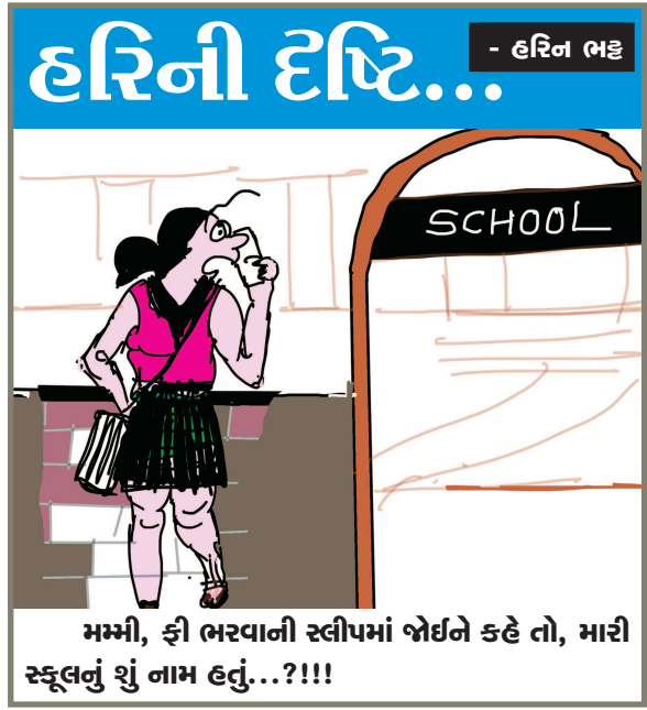
મમ્મી, ફી ભરવાની સ્લીપમાં જોઈને કહે તો, મારી સ્કૂલનું શું નામ હતું...?!!!!