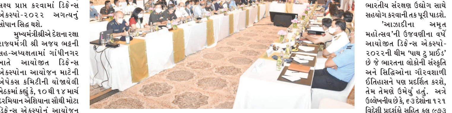
સરકારના સંપૂર્ણ સહયોગની પ્રતિબદ્ધતા આ સમિક્ષા બેઠકમાં ક્ષેત્રના ઉદ્યોગો અને તે માટેના મૂડી રોકાણકારોને ગુજરાતમાં સ્થાયી બિરદાવી હતી રક્ષા રાજ્યમંત્રીશ્રીએ વધુમાં

મુખ્યમંત્રીશ્રીએ ભારત સરકારના રક્ષા મંત્રાલયને ડિકેન્સ એક્સ્પો-૨૦૨૨ના સફળ અને ભવ્ય આયોજન માટે રાજ્ય વ્યક્ત કરી હતી. રક્ષા રાજ્ય મંત્રી શ્રી અજય ભટ્ટે જણાવ્યું કે, ડિકેન્સ એક્સ્પો-૨૦૨૨ના આયોજનથી રક્ષા થવાની તક મળશે. તેમણે ડિકેન્સ એક્સ્પો-૨૦૨૨ના આયોજન માટેની ગુજરાત સરકારની તૈયારીઓ અને વ્યવસ્થાઓને