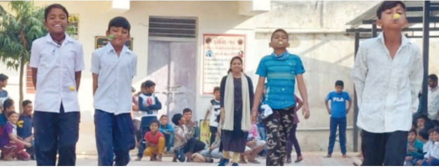
ગાંધીનગર, તા. ૨૭ પેથાપુર કુમાર-૧ પ્રાથમિક શાળામાં રમતોત્સવ યોજાયો કરવામાં આવી હતી. જેમાં બાળકોનો ઉત્સાહ વધારવા શિક્ષકોએ પણ ઉત્સાહપૂર્વક શ્રેણિયા દોડ, લીંબુ ચમચી, સંગીત પુરશી જેવી રમતોમાં ભાગ લીધો હતો.