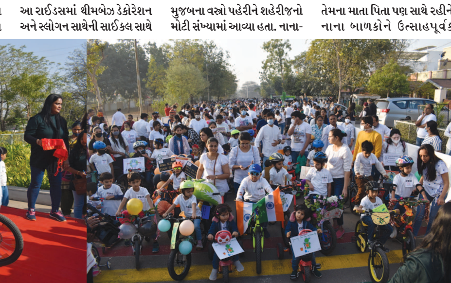
આયોજીતો આ મેરેથોનમાં સરકારી બિનસરકારી મળીને લગભગ ૫૦૦ નર્સરી સ્કૂલથી શરૂ કરી સ્વલ્પમ પાર્ક સુધી પહોંચી હતી. જેમાં ફન સાથેની આ સાયકલોથોન રેલી આકર્ષણનું કેન્દ્ર બની હતી. સવારે ૮ કલાકે થીમ નાના બાળકો આ સાયકલોથોનમાં આકર્ષણનું કેન્દ્ર રહ્યા હતા. જેમાં સાયકલીંગ માટે પ્રોત્સાહન આપી રહ્યા હતા. આ સાયકલોથોનની

ક્રેટેગરીઝ પ્રમાણે તેઓને બેસ્ટ ડે કોરેટેડ સાઈકલ અને બેસ્ટ સ્વોગનના એવોર્ડસ મેયર હિતેશભાઈ મકવાણા તથા અન્ય મહાનુભાવો દ્વારા એવોર્ડસ આપી બિરદાવવામાં આવ્યા હતા. આ સાયકલોથોનમાં નાના બાળકોના ઉત્સાહમાં વધારો કરવા મીકીમાઉસ, ભીમ, વેરેમોનના કાર્ટૂન પણ આ રેલીમાં જોડાયા હતા. ક્લીન સીટી... ગ્રીનસીટી, કચરાપેટીના અલગ ડબ્બાઓ, સ્વચ્છ ગાંધીનગર જેવા સ્વોગન દ્વારા સાયકલોથોન યોજીને ગાંધીનગરમાં જાગૃતિ અભિયાન કરવામાં આવ્યું હતું. બાળકોમાં નાનપણથી જ સ્વચ્છતા અંગે કેળવણી મળે રહે તે મહત્વનું કાર્ય શહેરમાં મહાનુભાવો કરી રહ્યા છે. જેમાં શહેરીજનો પણ મોટી સંખ્યામાં ભાગ લઈ રહ્યા છે.