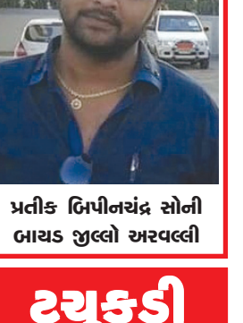
પ્રતીક ધિપીનચંદ્ર સોની બાયડ તુલ્લી અરવલ્લી