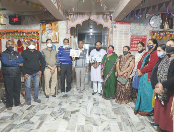
વિકાસના કામો માટે કાર્યક્રમમાં જઈ રહ્યા હતા તે સમયે તેમની સુરક્ષાને અવરોધ કરી ચુક કરવામાં