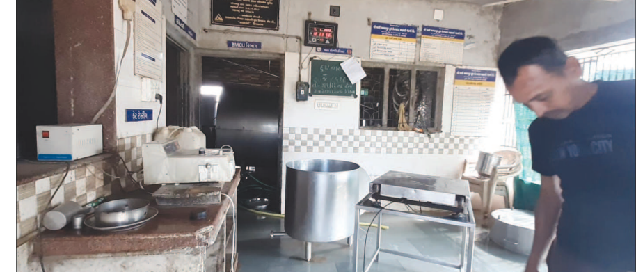
લિમિટેડ , સાબરડેરી , હિંમતનગર દ્વારા I.S.O ના ધારા ધોરણો મુજબ મંડળી તથા બીએમસીયુ યુનિટ ની સફાઈ બરાબર કરવામા આવતી ના હોય અને

પ્રાંતિજ તા.૭ સાબરકાંઠા જિલ્લા ના પ્રાંતિજ તાલુકા ના ખારી અમરાપુર ગામે આવેલ દુધ મંડળી મા સ્વચ્છતા નહી હોવાને લઈ ને સાબરડેરી દ્વારા નોટીસ પાઠવી એક દિવસ દુધ લેવાનુ ના પાડી કર્મચારીઓ ને દંડ ને પાત્ર ઠર્યા તો કર્મચારીઓના વાકે દુધ ગ્રાહકો પાસેથી સવાર સાંજ નુ દુધ ના લેતા ગ્રાહકો ને એક દિવસ નુ નુકસાન ગયુ ખારી અમરાપુર ગામે આવેલ દુધ ઉત્પાદક સહકારી