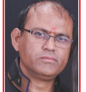
શૈલેષભાઈ કબગર શુભમ સ્ટુડિયો બાયડ જીલ્લો અરવલ્લી