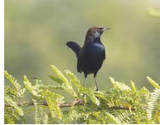
ભિલોડા તાલુકામાં આદિવાસી ભાઈઓ - બહેનો દ્વારા પોષ મહિનાના પહેલા શુક્રવારે ઉત્તરાયણની અનોખી રીતે વર્ષોની પરંપરા અનુસાર ઉજવણી કરાઈ છે. ભિલોડા તાલુકાના ખિલોડા ગામમાં દેવચકલી લીલા લીમડાના વૃક્ષ પર બેસતાં આગામી