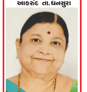
કૈલાસબેન હસમુખભાઈ શાહ વલ્લભ નગર સોસાયટી બાયડ જીલ્લો અરવલ્લી