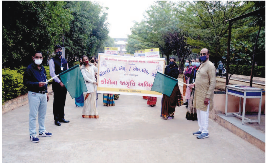
ચૌધરી બીએડ અને એમ.એડ. કોલેજ, સેક્ટર-૭ દ્વારા કોરોના જાગૃતિ અભિયાન અંતર્ગત રેલીનું આયોજન કરવામાં આવ્યું હતું. કોરોનાની રસી લેવા અંગે જાગૃતિ લાવવાનો આ રેલી દ્વારા પ્રયાસ કરવામાં આવ્યો છે.