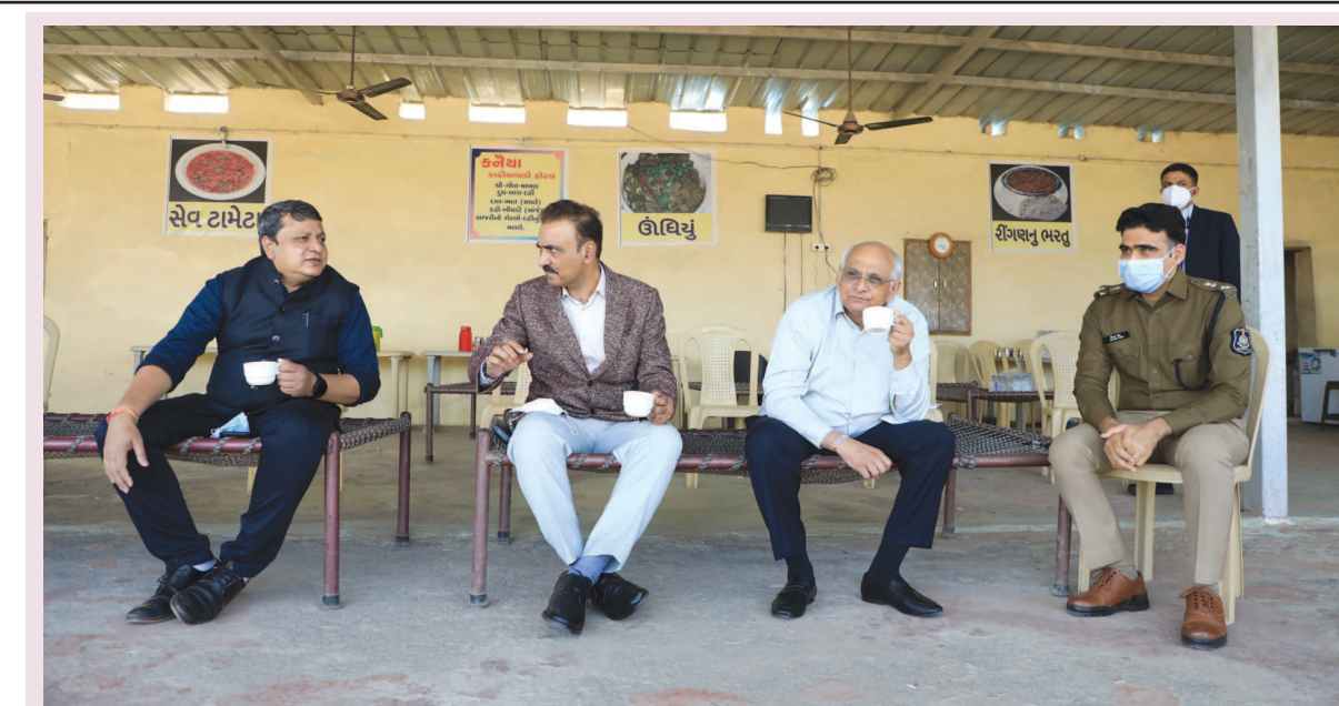
ગુજરાતના કોમનમેન - ગુજરાતના સી.એમ. આજે કોમનમેન બન્યા હતા... લીંબડી-રાજકોટ માર્ગના નિર્માણનું નિરીક્ષણ કરવા પહોંચેલ મુખ્યમંત્રીએ બગોદરા પાસેના ઢાંબા પર 'યા'ની વિજ્જત માણી હતી... મુખ્યમંત્રીની સાદગી અને સહજતા સૌને સ્પર્શી ગઈ હતી... સતત ચેમ્બરોમાં બિરાજમાન ઉચ્ચ અધિકારીઓ પણ મુખ્યમંત્રીની સાથે ઢાંબા પર 'યા' પીવા કંપની આપી હતી.

ગાંધીનગર, તા. ૮ ગાંધીનગર શહેરના મહાનગરપાલિકા દ્વારા એકાદ સપ્તાહમાં વેટ વેસ્ટ મેનેજમેન્ટ અંગેનું જાહેરનામું પ્રસિદ્ધ કરવામાં આવે તેવા સંકેતો મળી રહ્યા છે. ગાંધીનગર શહેરની હદ વધતાં સોલિડ વેસ્ટ મેનેજમેન્ટ પછી હવે વેટ વેસ્ટ મેનેજમેન્ટનું પણ જાહેરનામું બહાર પાડવાની કાર્યવાહી હાલ તેના અંતિમ તબક્કામાં છે. નવા વિસ્તારોમાં ગટર વ્યવસ્થાના અભાવે ખાળકુવાઓ છે આ ખાળકુવાના વેસ્ટનો નિકાલ યોગ્ય રીતે થાય તે માટે આ જાહેરનામું પ્રસિદ્ધ કરવામાં આવશે. મળતી વિગતો પ્રમાણે વેટ વેસ્ટ મેનેજમેન્ટની કામગીરી કરતી એજન્સી કે સંસ્થાઓનું મનપામાં રજીસ્ટ્રેશન કરવામાં આવશે. આ માટે વેટ વેસ્ટ કલેક્શન માટે અલગથી વાહનો પણ રખાશે. જેથી નિયત કરાયેલા સ્થાનો પર જ આ વેટ વેસ્ટનો નિકાલ થાય. ગાંધીનગર શહેરને સ્વચ્છ નગર બનાવવા માટે આગામી દિવસો સ્વચ્છતા અભિયાન અંગેનું પણ આયોજન હાથ ધરવામાં આવ્યું હોવાનું તંત્રના સૂત્રોએ જણાવ્યું છે. વેટ વેસ્ટ મેનેજમેન્ટના અમલીકરણ માટે એજન્સીઓ કે સંસ્થાના પ્રતિનિધિઓ સાથે પણ બેઠક કરવામાં આવશે તેમ જાણવા મળેલ છે.