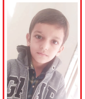
મંત્ર વિનોદભાઈ પંચાલ શ્રીજી સોસાયટી બાયડ જિલ્લો અરવલ્લી