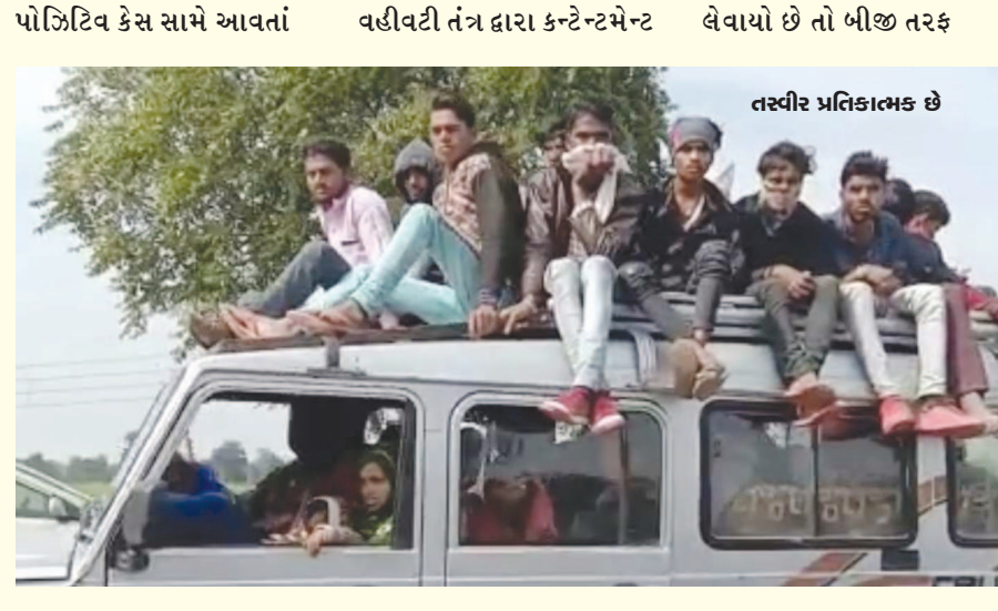
પોઝિટિવ કેસ સામે આવતાં વહીવટી તંત્ર દ્વારા કન્ટ્રેન્ટમેન્ટ લેવાયો છે તો બીજી તરફ શટલિયાં વાહનોમાં મુસાફરોની સંખ્યા મુદત કોઈ ગાર્ડલાઈન જારી ન કરાય હોય તેવી સ્થિતિ જોવા મળતાં મારક પહેલાં વગરની મુસાફરીની ભીડ આગામી સમયમાં સુપરસ્પ્રેડર બનવાની દહેશત વ્યક્ત થઈ છે. બંને જિલ્લામાં વર્તમાન કોરીનાની ચિંતાજનક સ્થિતિમાં પણ એસ.ટી. બસમાં કમતા કરતાં વધુ મુસાફરો તેમજ શટલિયા વાહનોમાં ઘેટાં-બકરાંની જેમ મુસાફરો ભરી દોડી રહ્યાં છે જેના કારણે મુસાફરોની ભીડથી કોરીના વિસ્ફોટ થઈ શકે છે.

બાયડ (બ્યુરો ઓફિસ), તા. ૧૦ કોરીનાનું સંક્રમણ મુસાફરોની ભીડ સુપરસ્પ્રેડર બનવાની દહેશત વ્યક્ત થઈ સહિતના સરકારી કાર્યક્રમો ૨૬ કરી સંક્રમણ રોકવા માટે ખાસ ગાર્ડલાઈન જારી કરી છે પરંતુ તેનો યોગ્ય રીતે અમલ નહીં થાય તો ત્રીજી લહેર અગાઉની ભીજી લહેરની જેમ વધુ ઘાતક સાબિત થઈ શકે છે. સાબરકાંઠા, અરવલ્લી જિલ્લામાં છેલ્લા એક સપ્તાહથી કોરીનાના નવા પોઝિટિવ કસની સંખ્યામાં ચિંતાજનક વધારો થયો. વહીવટી તંત્ર દ્વારા કેટલાક નિયમો જારી કરવામાં આવ્યા પરંતુ તેનું કયાંય પાલન થતું નથી. સાબરકાંઠામાં ૨૮ અને અરવલ્લી જિલ્લામાં ૧૧ નવા