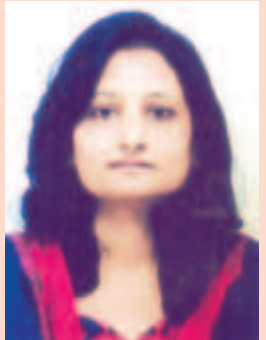
દક્ષા ખાંડવ (સેક્ટર) લાયોનેસ ક્લબ ઓફ ગાંધીનગર ફેમીના